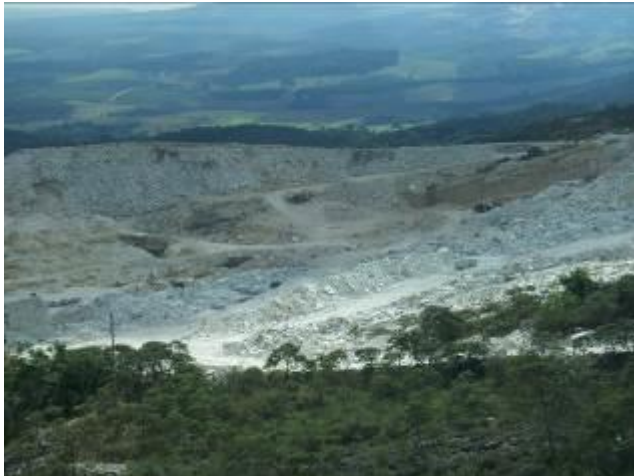
Foto 9. Pilha de estéril.