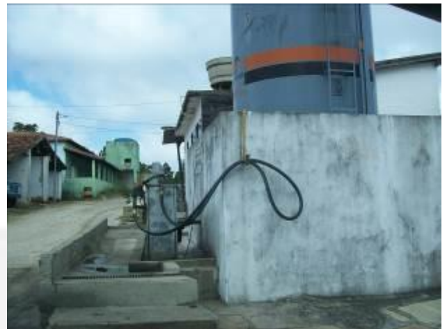
Foto 04. Ponto de abastecimento.