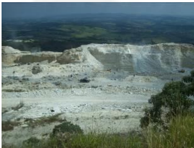
Foto 07. Frente de lavra.