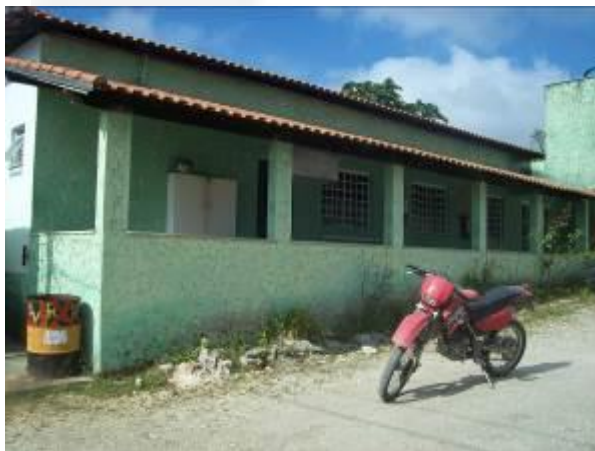
Foto 01. Vista do refeitório.