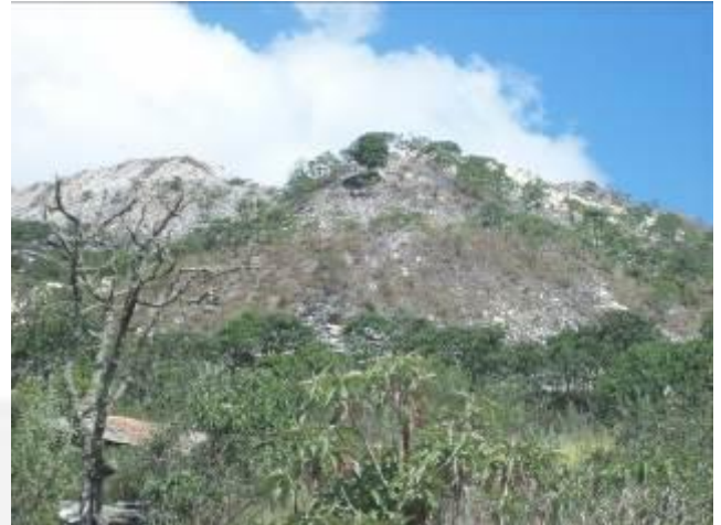
Foto 10. Pilha de estéril em processo de revegetação.