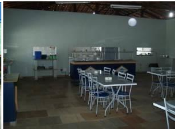
Foto 02. Refeitório.