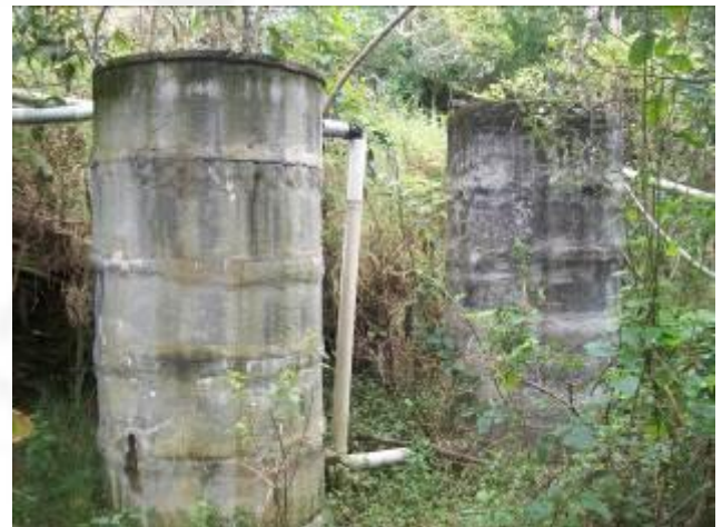
Foto 06. Sistema de tratamento de efluente sanitário com fossa séptica e filtro anaeróbio.