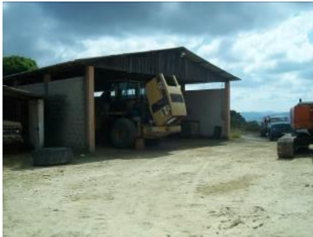
Foto 03. Oficina.