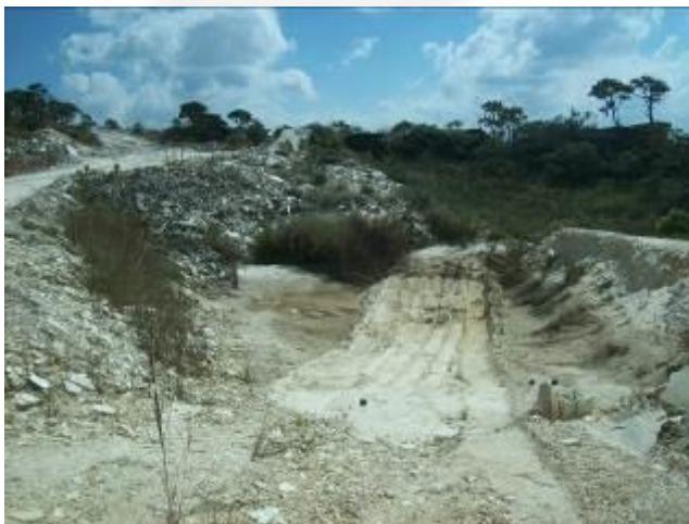
Foto 11. Bacia de contenção de finos.