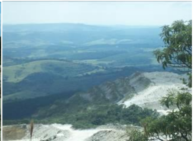
Foto 12. Pilha de estéril em processo de revegetação.