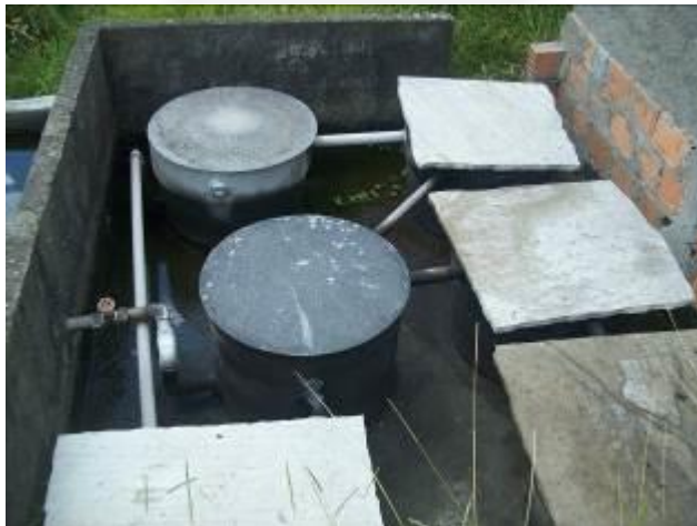
Foto 05. Sistema de Caixa SAO.