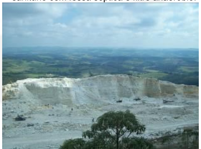
Foto 08. Frente de lavra.