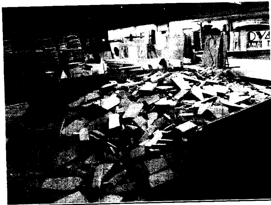
Foto 4 - Aparas

Handwritten signatures and initials, including 'DVA' and 'RUBRICA'.