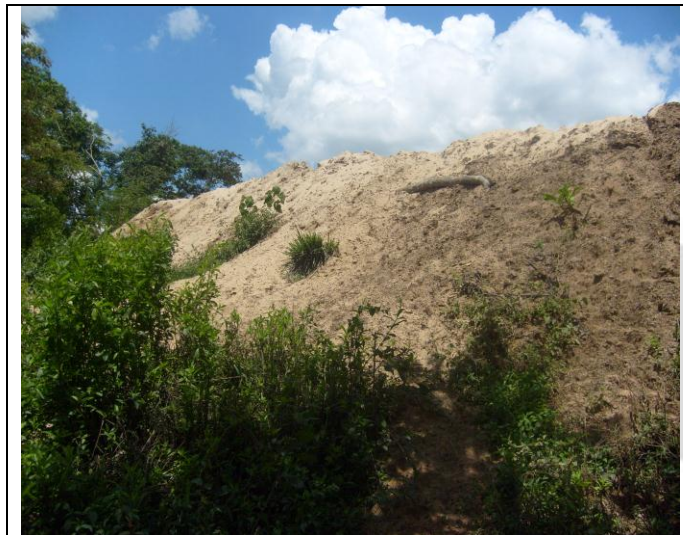
Foto 15: Desnível acentuado inviabiliza uma alternativa locacional