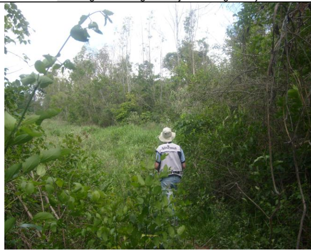
Foto 11: Transição da reserva em área de silvicultura para área de floresta estacional semidecidual