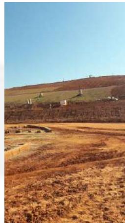
Foto 02. Talude revegetado ---