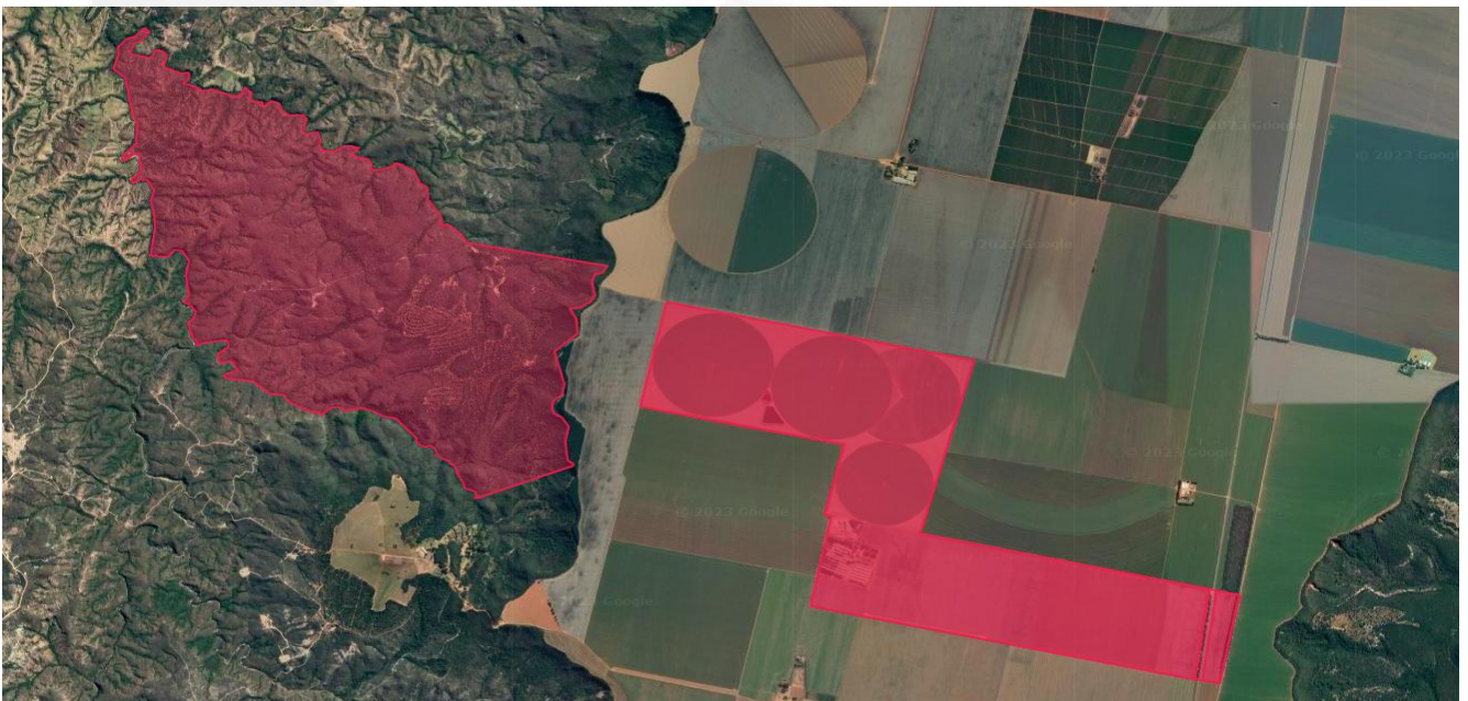
Figura 01 -Visão geral da Fazenda.

As Fazendas Bom Retiro, Barreiro, Roncador e Manabuiú, alvo do presente licenciamento, possui área matriculada de 1.490,8388 hectares, figura 01.