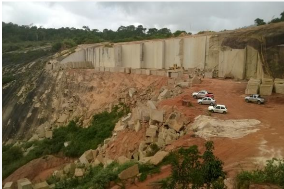
Foto 1. Frente de lavra a ser ampliada.