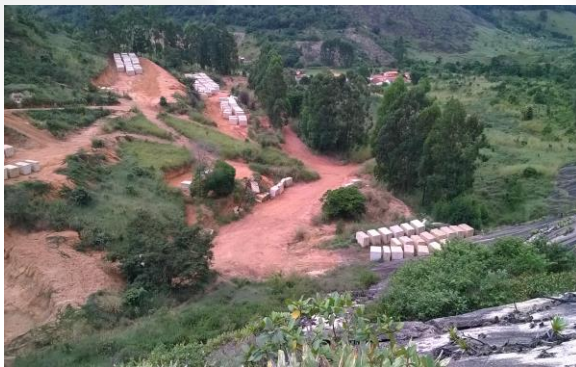
Foto 3. Área de depósito de blocos.