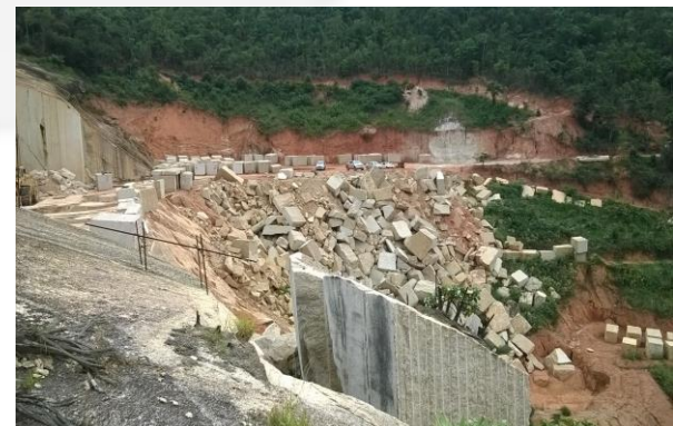
Foto 6. Pilha de rejeito/estéril.