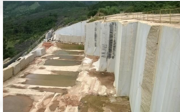
Foto 2. Frente de lavra a ser ampliada.