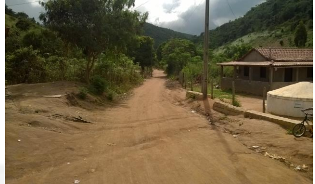
Foto 8. Vista da Comunidade de Pedra Alta.