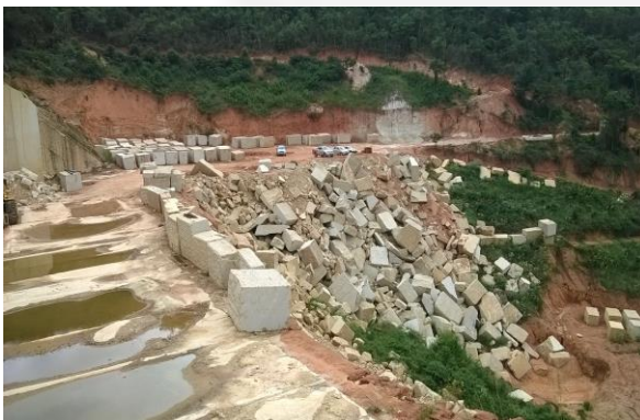
Foto 5. Pilha de rejeito/estéril.