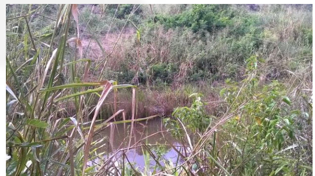
Foto 10. Ponto de captação d' água.