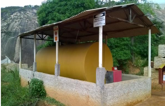
Foto 7. Tanque de abastecimento.