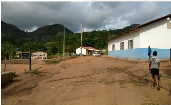
Foto 9. Vista da Comunidade de Pedra Alta.