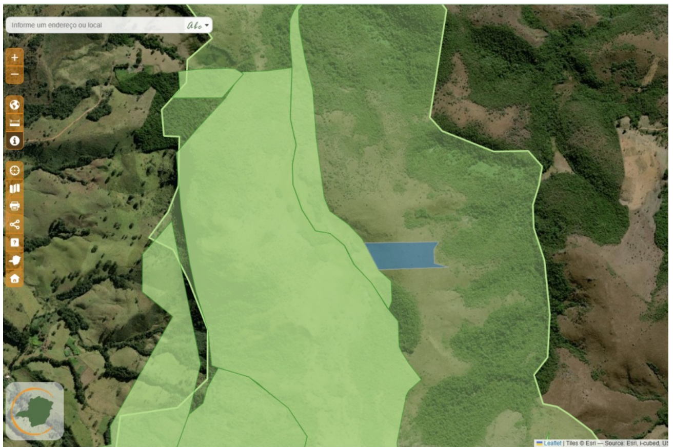
Imagem 2: Parque Estadual Serra do Papagaio-PESP em limites em verde, e a área proposta para a compensação deste processo, em azul.

Estando a área de intervenção, bem como a área proposta para a devida compensação, localizadas na Bacia Hidrográfica do Rio Grande, e conforme imagens da área proposta, não há constatação de benfeitorias na referida área.