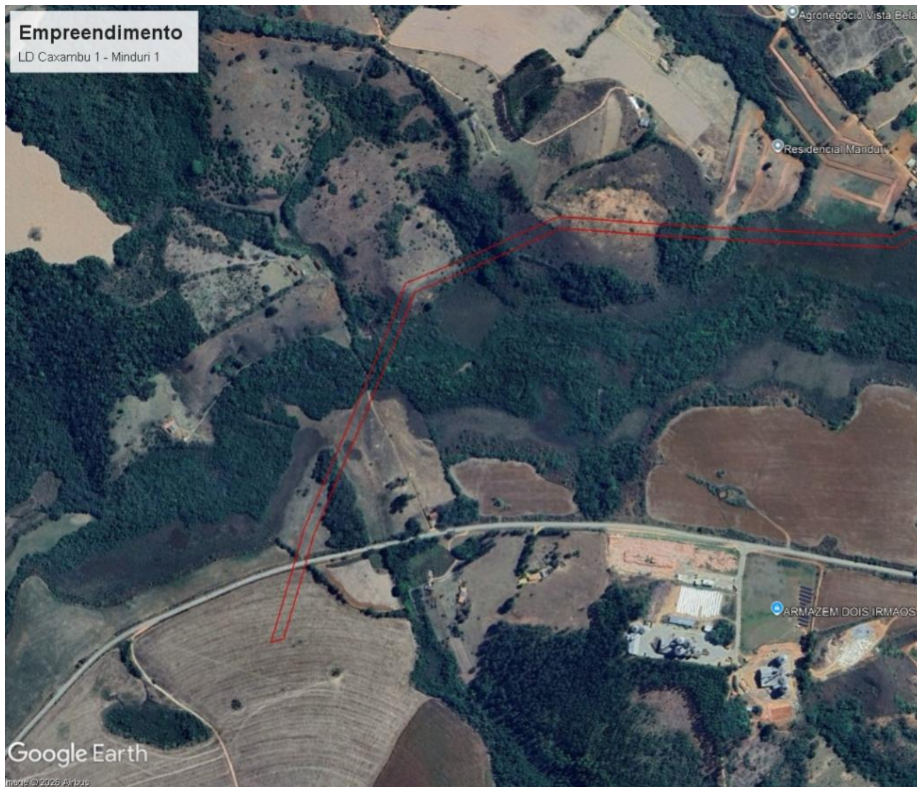
Imagem 1: Traçado total da referida linha de distribuição (em vermelho).

Conforme estudos apresentados, a formação natural de Floresta Estacional Semidecidual (1,0609ha) e campo sujo (0,7068ha) ambos em estágio médio de regeneração, ocupando uma área total de 1,7577ha , representando aproximadamente 23% da faixa de servidão do empreendimento, sendo que 0,3348ha destas formações florestais estão localizados dentro de APP, entretanto este processo de compensação se refere apenas à compensação por supressão de vegetação nativa em estágio médio de regeneração no Bioma Mata Atlântica, não contemplando compensação por intervenção em APP, o que deverá ser tratado no processo de intervenção.