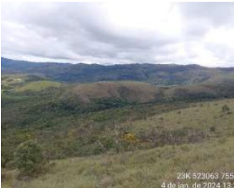
Imagem 4: Vista da área em Campos de Altitude na propriedade.

Já as formações de Floresta Ombrófila Montana apresentaram bom estado de conservação e grande diversidade estrutural, com a ocorrência frequente de epífitas de diversos grupos taxonômicos (orquídeas, bromélias, peperômias e briófitas), além de cipós e de líquens abundantes neste tipo de fitofisionomia.