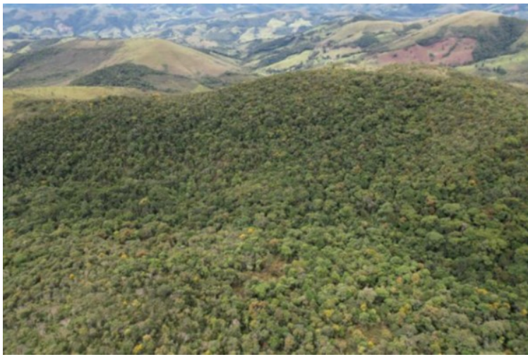
Imagem 5: Vista aérea da Floresta Ombrófila Densa Montana na propriedade.

Conforme proposta apresentada e já informado anteriormente, para a viabilização do empreendimento, fez-se necessária a supressão de 1.7677 hectares de vegetação nativa do Bioma Mata Atlântica (Floresta Estacional Semidecidual e campo sujo em estágio médio de regeneração natural) localizada na bacia hidrográfica do Rio Grande, gerando então, a obrigatoriedade de compensação florestal de 3,5453ha .