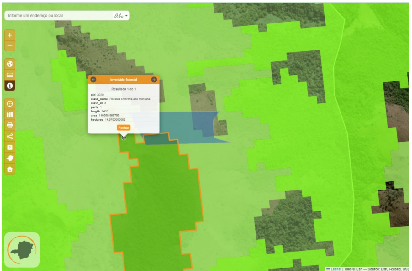
Imagem 3: Especificando a área proposta neste processo em fitofisionomia de Floresta Ombrófila Montana e uma boa parte em Campo, conforme inventário florestal - IDE.

Mais especificamente, a área proposta para esta compensação de 3,5453ha , imagem acima, fica na parte mais ao norte da propriedade, onde possui uma vegetação típica de formações campestres (campo de altitude), e parte em formações Floresta Ombrófila Montana, que predominaram nas encostas e nas calhas de cursos d'água em altitudes variando de 1.500 a 1.700 metros.