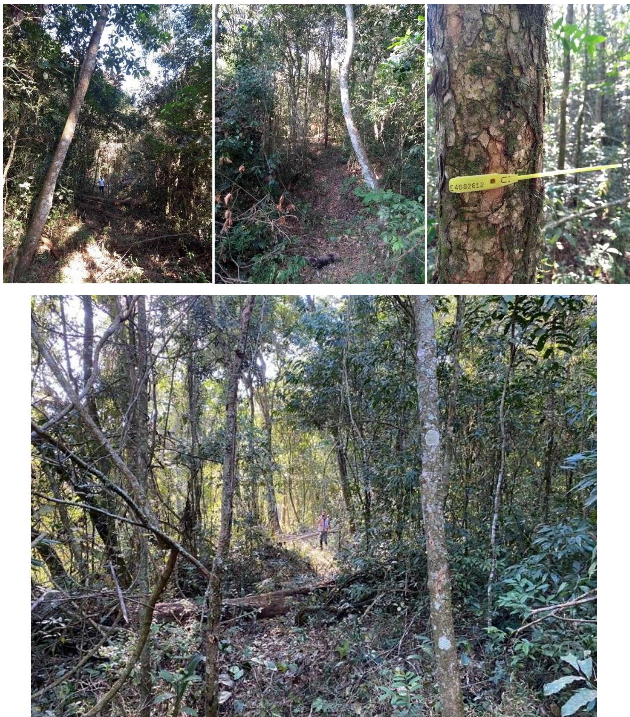
FIGURA 2 – Trechos com fitofisionomia de Floresta Estacional Semidecidual.