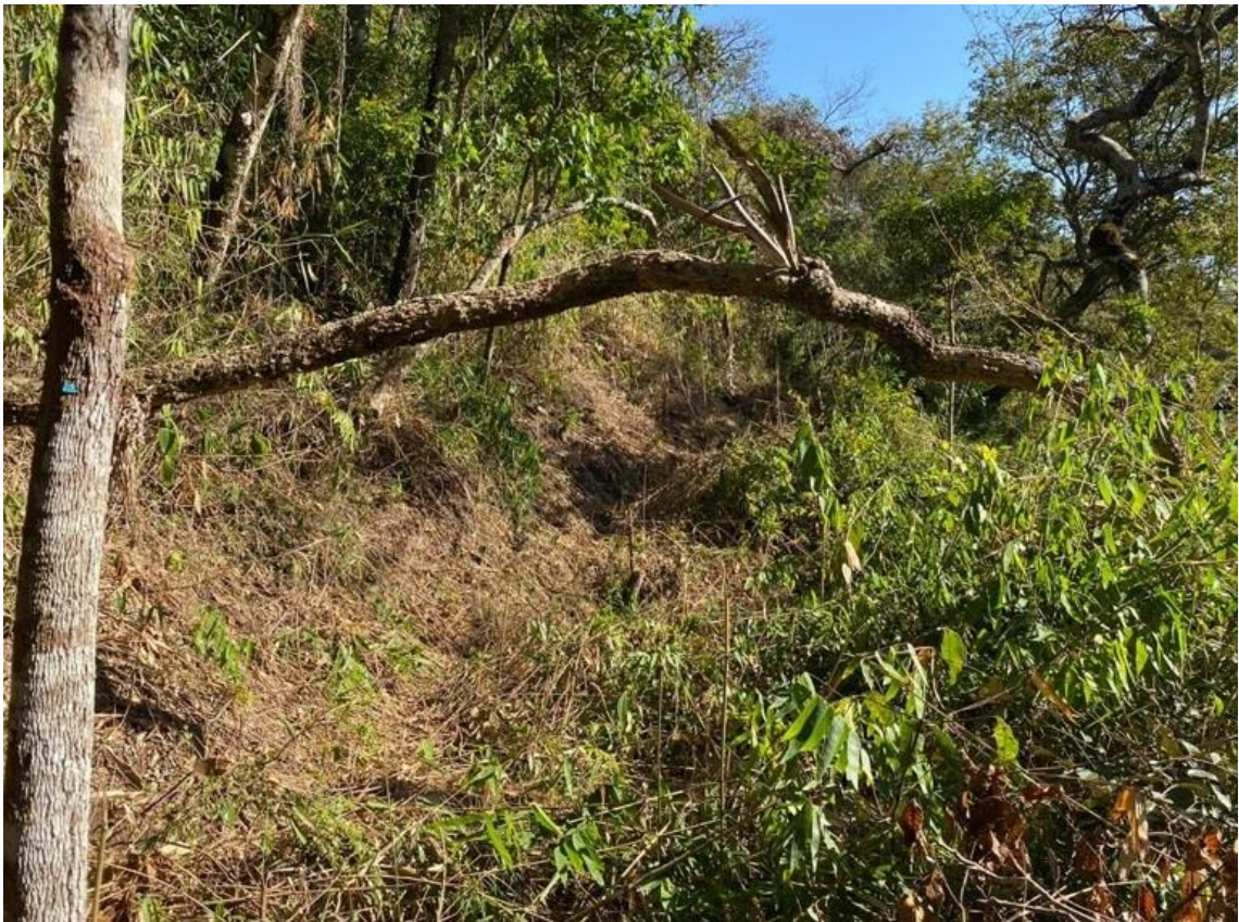
FIGURA 2 – Trechos com fitofisionomia de Cerrado.