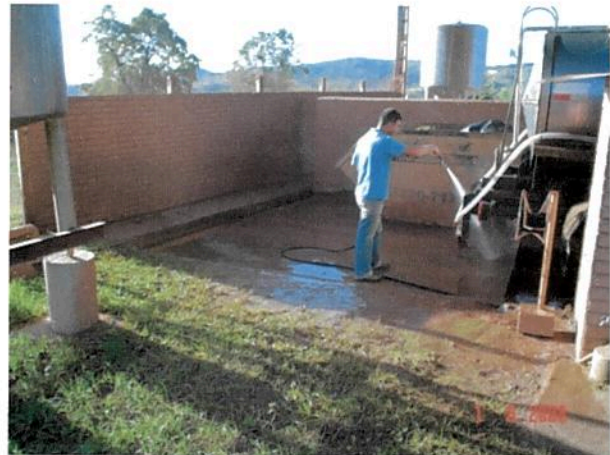
As fotos abaixo, mostra, os resíduos/efluentes da lavação dos caminhões, e uma canaleta com o lançamento, em direção ao curso d'água "ribeirão Paciência".