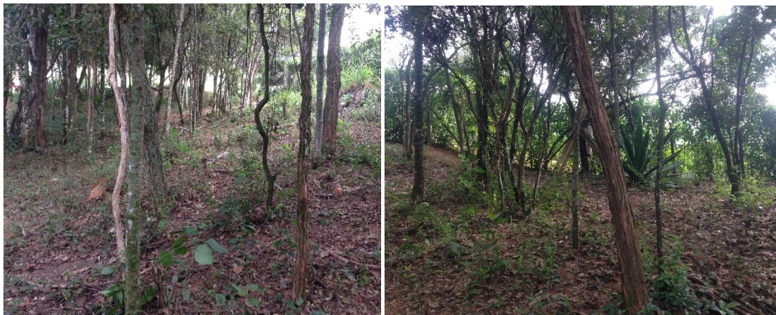
Foto 03 e 04- Área proposta para compensação.

A área onde ocorrerá a compensação florestal será na própria propriedade, sendo assim, as características ambientais são aquelas informadas na caracterização da área de intervenção. O referido fragmento se apresenta de forma raleada, conforme Fotos 3 e 4 .