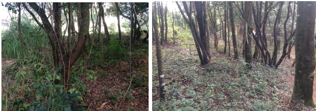
Fotos 01 e 02 -Ilustra área de intervenção, árvores esparsas.

A área requerida para intervenção de 254,12m 2 ou 0,0254ha apresenta espécies nativas arbóreas/arbustivas e presença de sub-bosque ( Fotos 1 e 2 ).