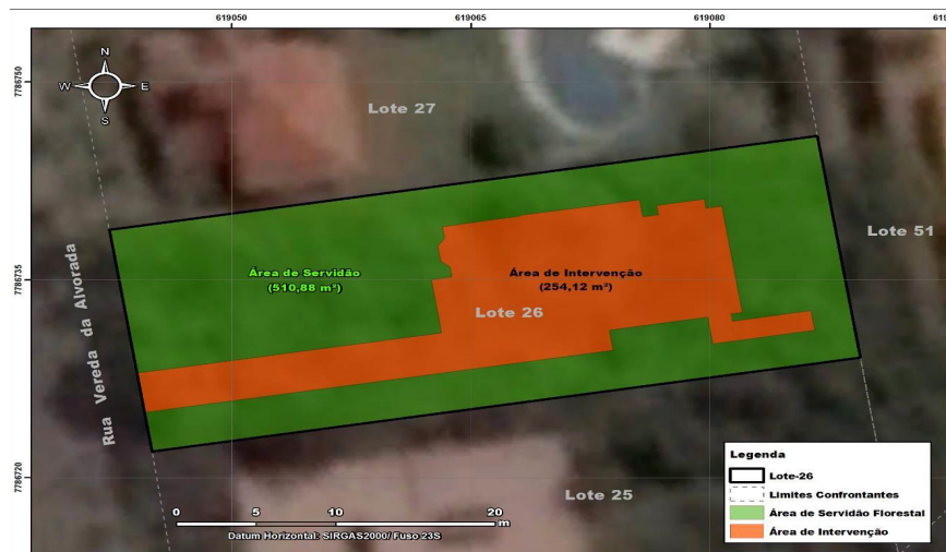
Figura 1. Poligonal da área intervinda.

O quadro a seguir mostra em síntese as características da área intervinda: