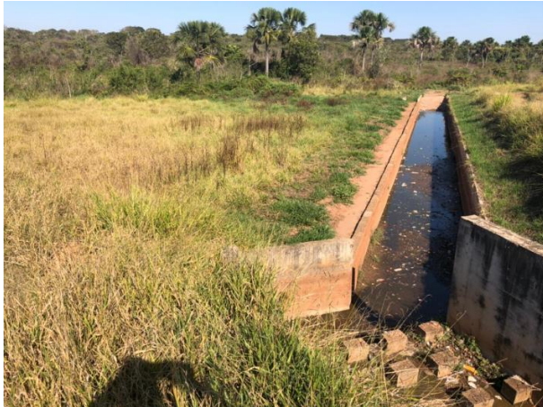
Figura 5: Dissipador.