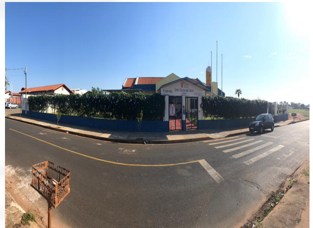
Figura 2: Centro Educacional Crescer III – Profª Maria Fátima Borges.