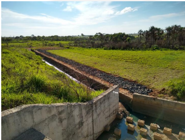
Figura 7: Dissipador e PRAD.