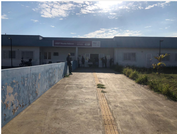
Figura 1: UBSF Monte Hebron.