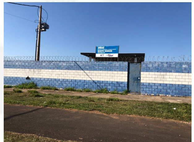
Figura 4: EEE.