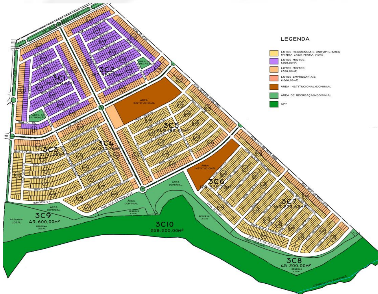
FIGURA 2: Masterplan do empreendimento.

Obs.: a figura é apenas uma representação, sem escala.