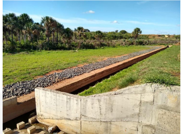
Figura 6: Dissipador e PRAD.