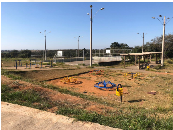
Figura 3: Equipamentos de lazer.