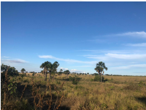
Figura 9: APP e PTRF.