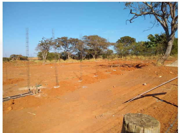
Figura 10: Implantação do Ecoponto.