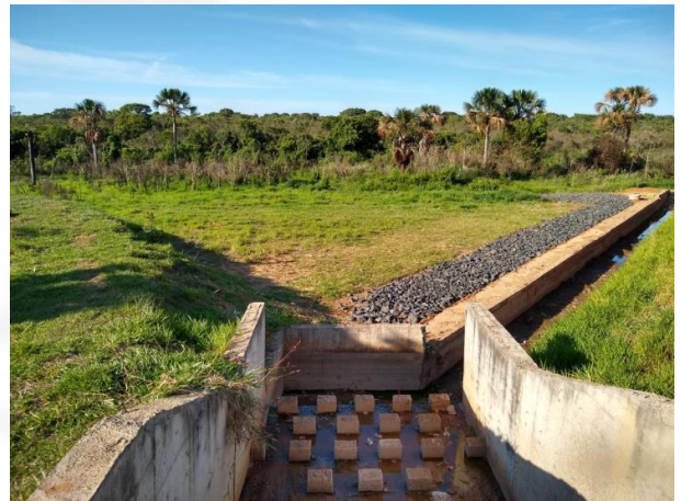
Figura 8: Dissipador e PRAD.