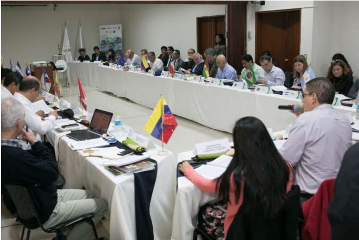
Reunião do Diretório da Rede Iberoamericana de Bosques Modelo, em 13 de junho de 2017, em La Molina, Peru