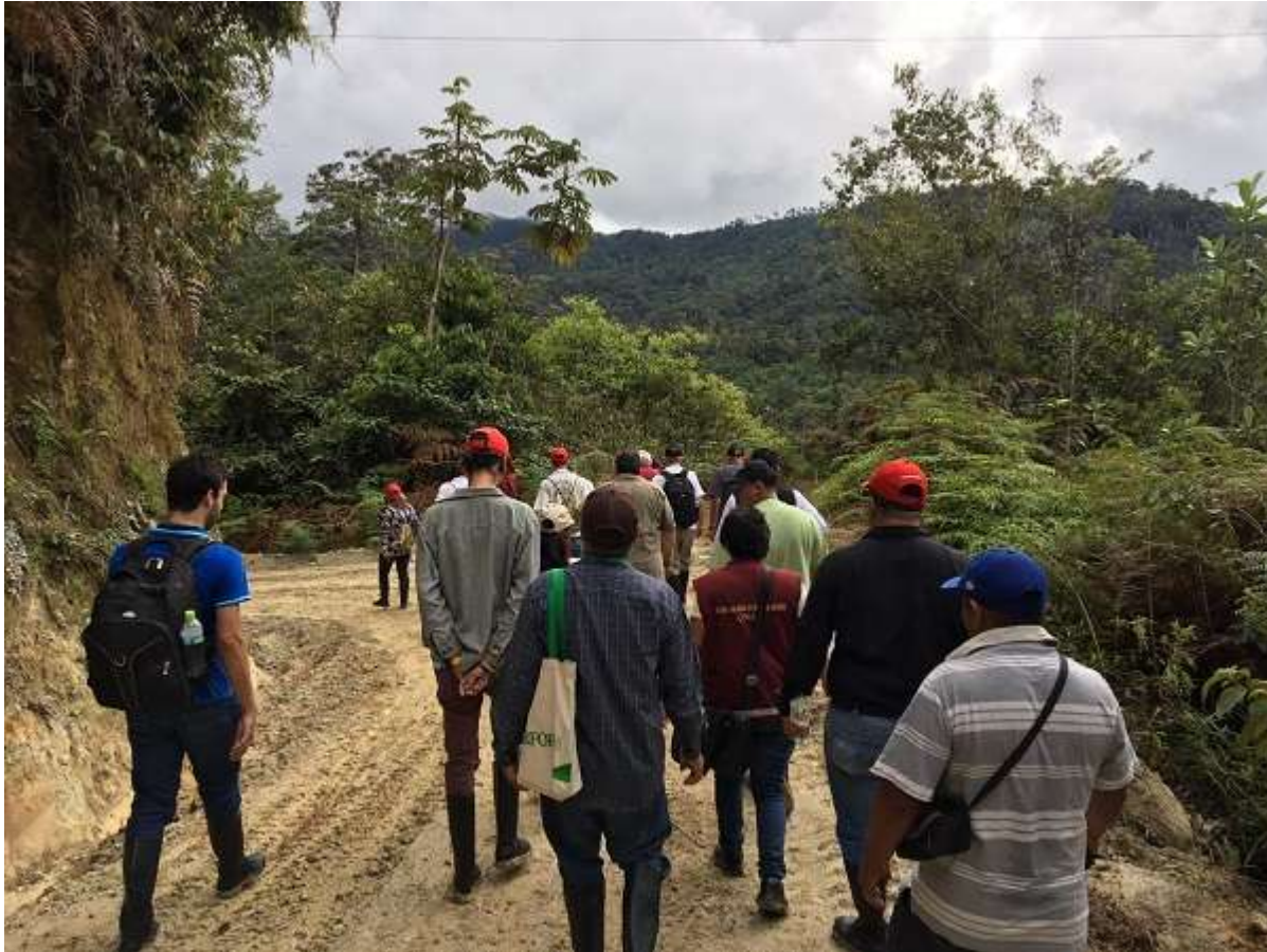
Trilha de acesso à Floresta de Proteção Pui Pui, Pichanaki (PER)