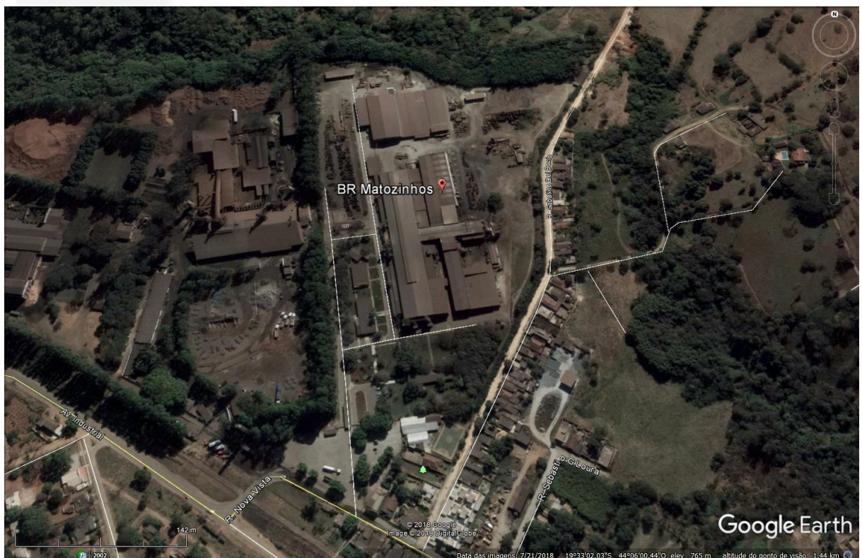
Figura 2: Imagem contendo a BR Matozinhos e siderúrgica ao lado.