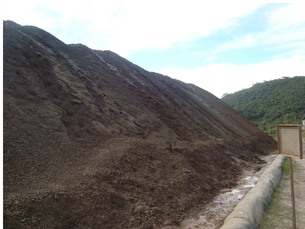
Foto 01. Planta de Lixiviação