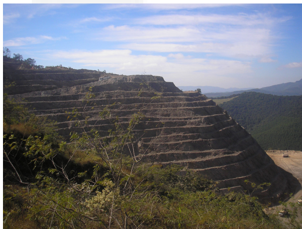
Foto 03. Área da Cava