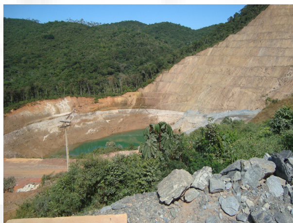
Foto 04. Local onde será a pilha de estéril