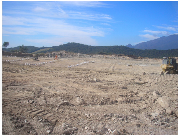
Foto 02. Área da Cava