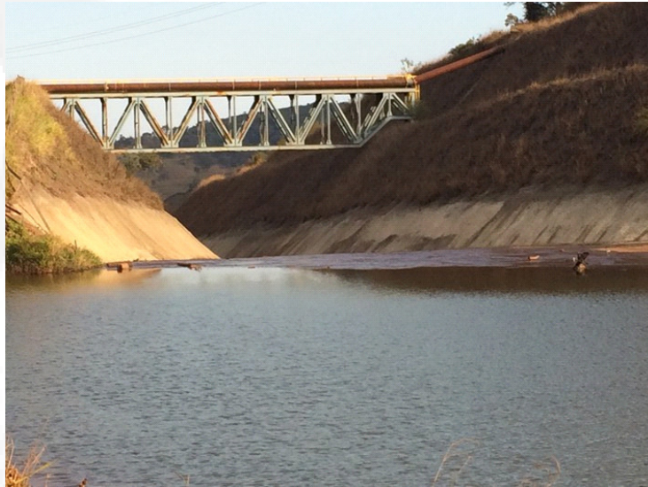
Figura 9. Visão frontal do extravasor