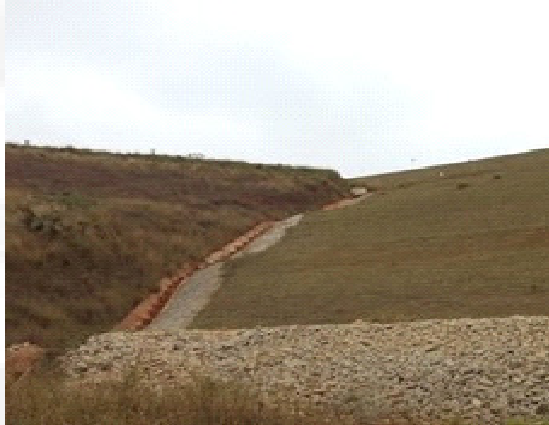
Figura 8. Drenagem na ombreira esquerda da Barragem Casa de Pedra.

Com relação à drenagem externa, os encontros das ombreiras apresentam descidas de água em concreto, canaletas trapezoidais nas bermas e descidas em degraus, como pode ser visto na Figura 3. O sistema de drenagem superficial instalado na barragem e dique de sela é composto por canaletas de bermas e canais periféricos, ambos em concreto armado.