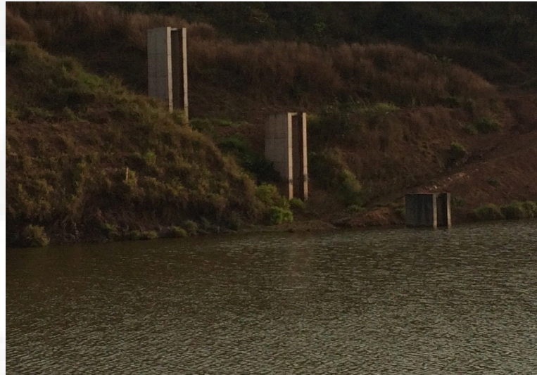
Figura 11. Tulipas.

Para esclarecimentos, as tulipas consistem em torres de concreto armado construídas dentro do reservatório que possuem "janelas" que possibilitam o controle da altura do nível da água contida no mesmo.