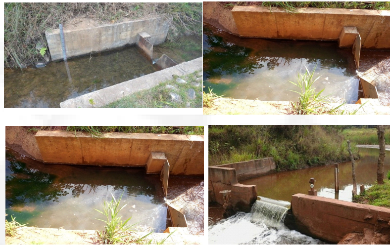
Figura 6. Medidores de vazão. Barragem Casa de Pedra.

Para o monitoramento das vazões percoladas pelo sistema de drenagem interna do maciço e fundação, a barragem Casa de Pedra conta com 03 (três) vertedouros triangulares localizado à jusante do dreno de “pé” da barragem nas estacas 35, 24, à jusante da seção principal do Dique de Sela. Também possui o vertedouro triangular a jusante do canal extravasor para medir a vazão de restituição ao córrego Figueiredo conforme ilustrado na Figura 1.