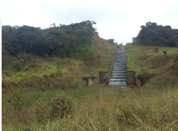
Figura 10. Canal extravasor. Vista da descida em degraus.

Para esclarecimentos, o sistema extravasor de uma barragem visa, basicamente, permitir o escoamento da vazão máxima de enchente e a proteção do local de restituição das águas vertidas ao curso d'água.