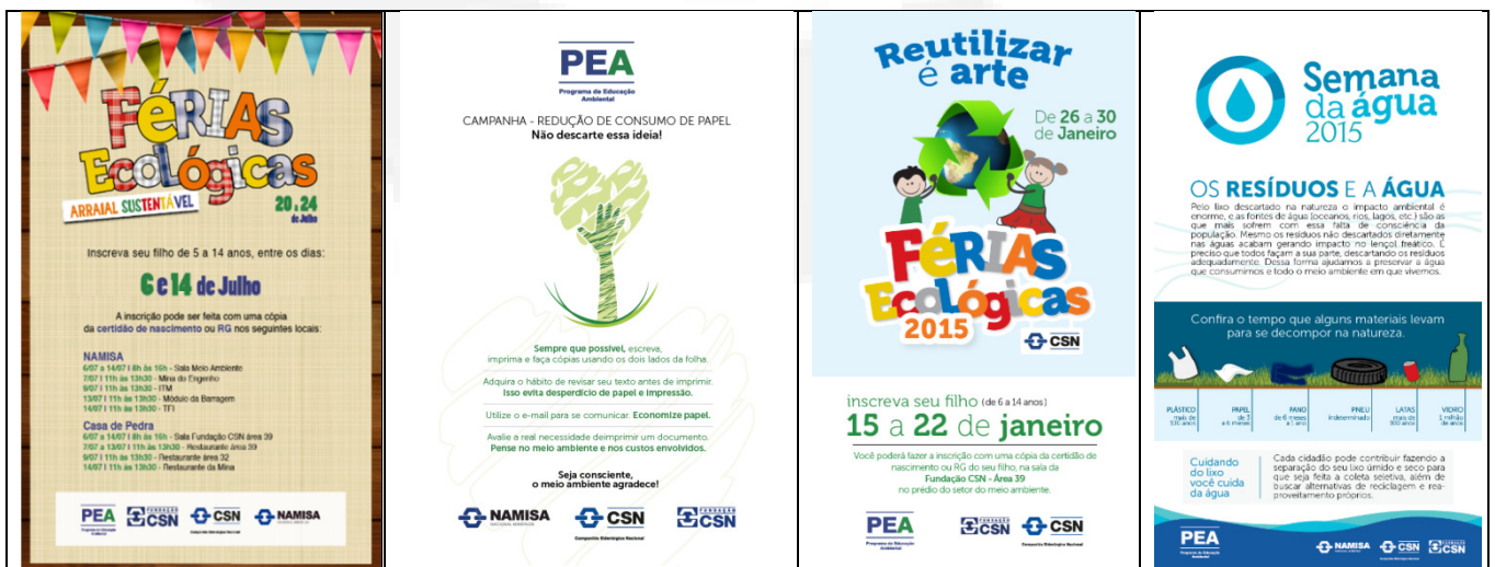
Figura 2: Divulgação de ações vinculadas ao PEA.

Para o público interno, além das atividades pontuais realizadas nas datas comemorativas ambientais de relevância (Dia da Água, Dia do Meio Ambiente e Dia da Árvore), são trabalhadas várias ações de conscientização de modo a desenvolver, com os funcionários próprios e contratos, conhecimentos sobre aspectos, impactos e riscos ambientais que possibilitem atitudes individuais e coletivas de mitigação, conservação e respeito ao Meio Ambiente, no desenvolvimento de suas atividades profissionais e cotidianas.