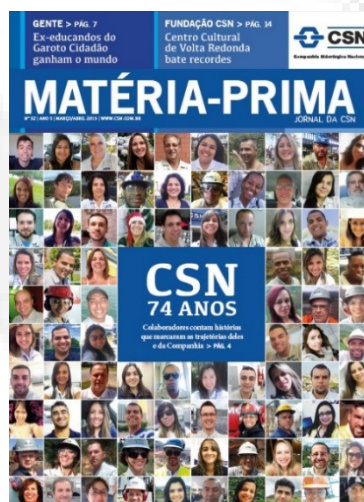
Figura 3: Periódico.

Em relação à mídia impressa o empreendedor apresentou os seguintes periódicos: