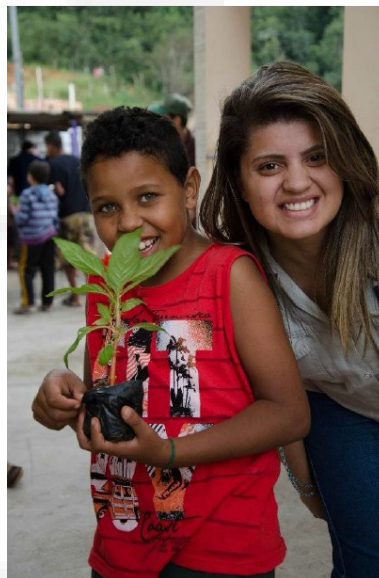
Figura 5: Programa de voluntariado.

Voluntário Cidadão: O programa de voluntariado da CSN realiza campanhas e ações durante todo o ano direcionadas para 8 instituições da região que atendem crianças, adolescentes, idosos e deficientes visuais.