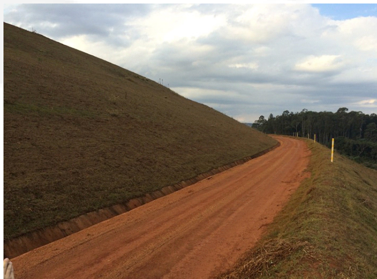
Figura 7. Cobertura vegetal no talude a jusante do barramento.

O talude de montante - interno, de contato com rejeito e água - possui revestimento de uma camada de laterita como forma de proteção contra as oscilações do nível de água do reservatório. O talude de jusante, por sua vez, recebe revestimento vegetal por gramas em placas (Figura 2), evitando processos erosivos.