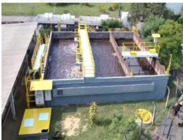
Figura 03. Estação de Tratamento de Esgoto.