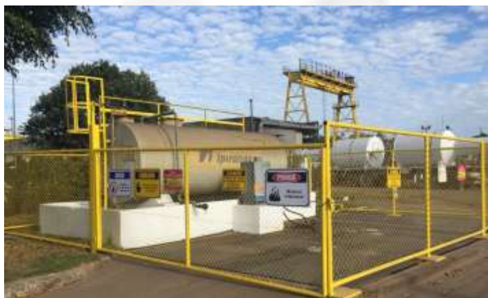
Figura 04. Ponto de abastecimento.