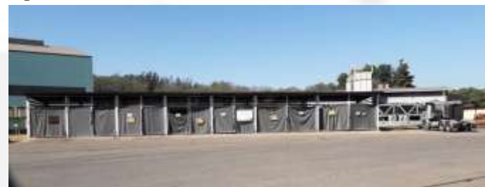
Figura 06. Central de resíduos perigosos.