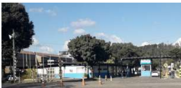
Figura 01. Visão geral do empreendimento.