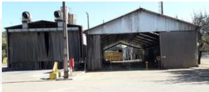
Figura 02. Cabine de Pintura 3 e Cabine de Pintura Móvel.