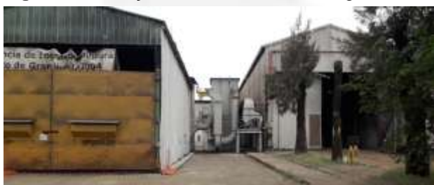
Figura 05. Cabine de Jato 04.