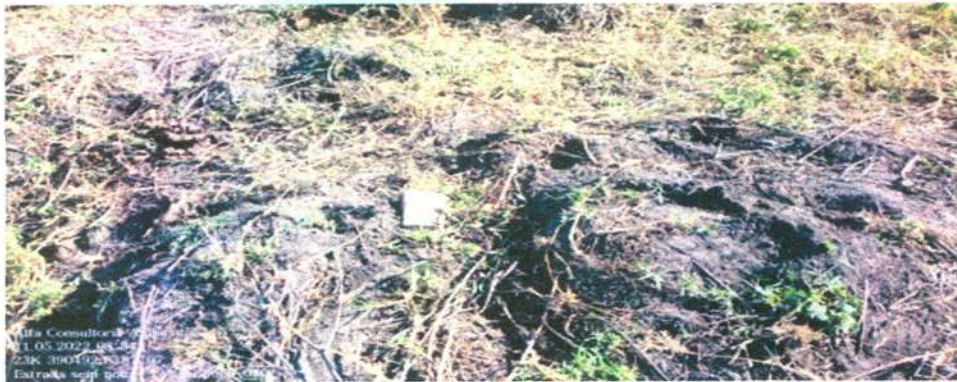
Figura 12: Vestígios de carvoaria antiga

Para finalizar, as imagens 15, 16 e 20 (árvores caídas) comprovam a ausência de desmate, senão vejamos: