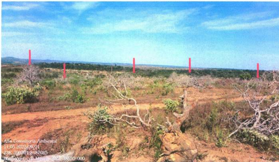
Figura 16: Árvores isoladas

ALFA CONSULTORIA AMBIENTAL & CIVIL Rua Álvaro Pires, nº 150 - União/MG (35) 3676-6923/99936-6611