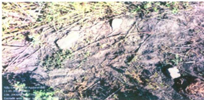
Figura 11: Vestígios de carvoaria antiga

Em um local próximo a sede, foi encontrado vestígios da existência de uma carvoaria antiga, foram observados tijolos e solo expostos por carvão, corroborando com os relatos do proprietário que a área foi limpa há muito tempo.