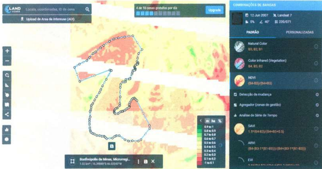
Figura 23: Análise do NDVI no polígono de limpeza, imagem do satélite Landsat 7, de 12 de Junho de 2022.

ALFA CONSULTORIA AMBIENTAL & CIVIL Rua Afonso Pena, nº 160 – Unaí/MG (38) 3676 6923/ 99936-6611