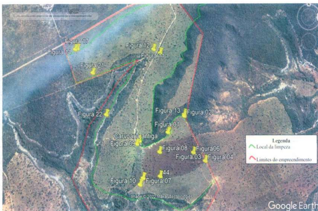
Figura 20: Imagem do Google Earth satélite, Julho de 2018.