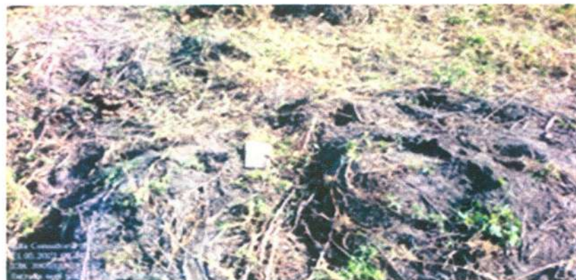
Figura 12: Vestígios de carvoaria antiga