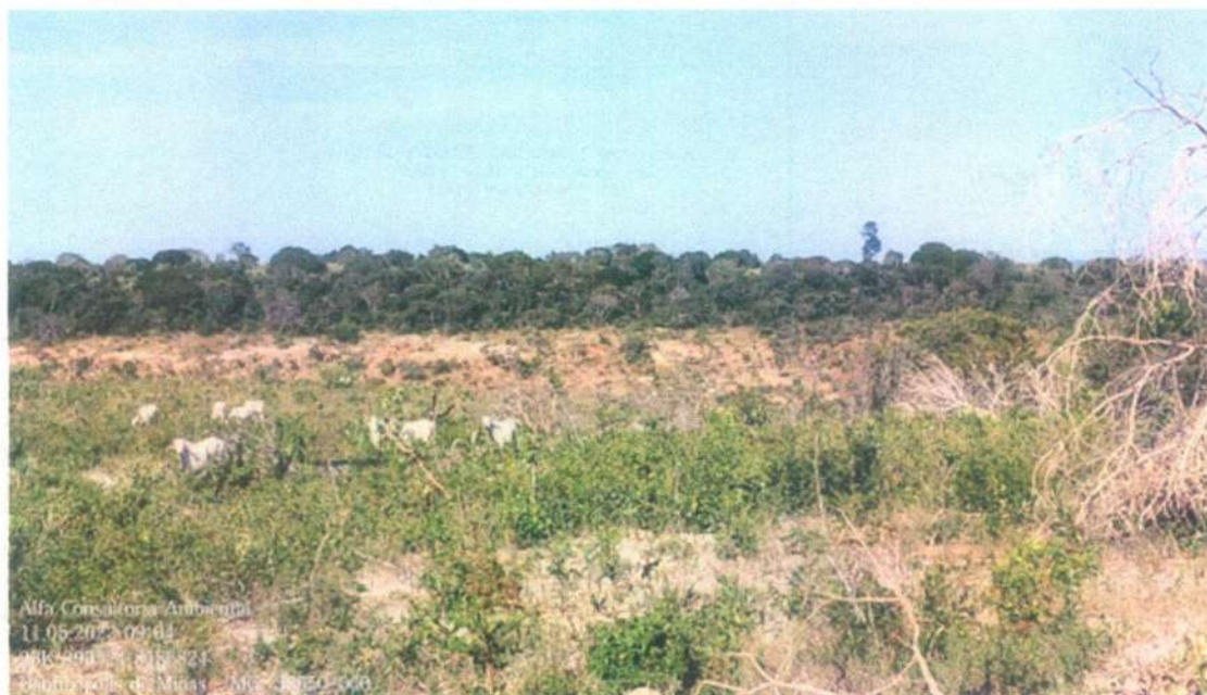
Figura 10: Bovinos presentes no local da vistoria

Também foram encontrados no local, vestígios de fornos antigos, o que comprova o desmate anterior e corrobora com ausência de desmate descrito no laudo.