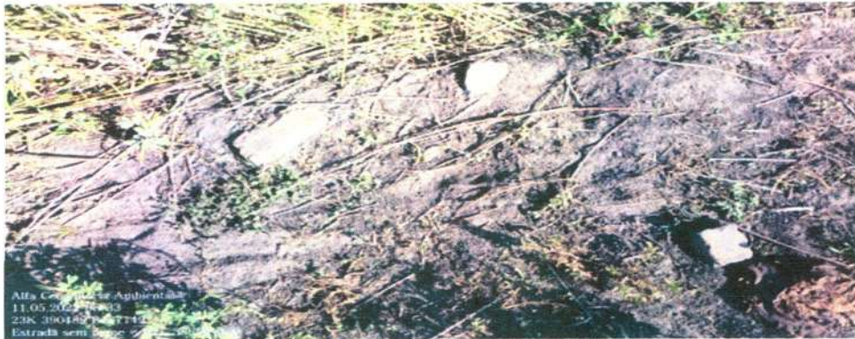
Figura 11: Vestígios de carvoaria antiga