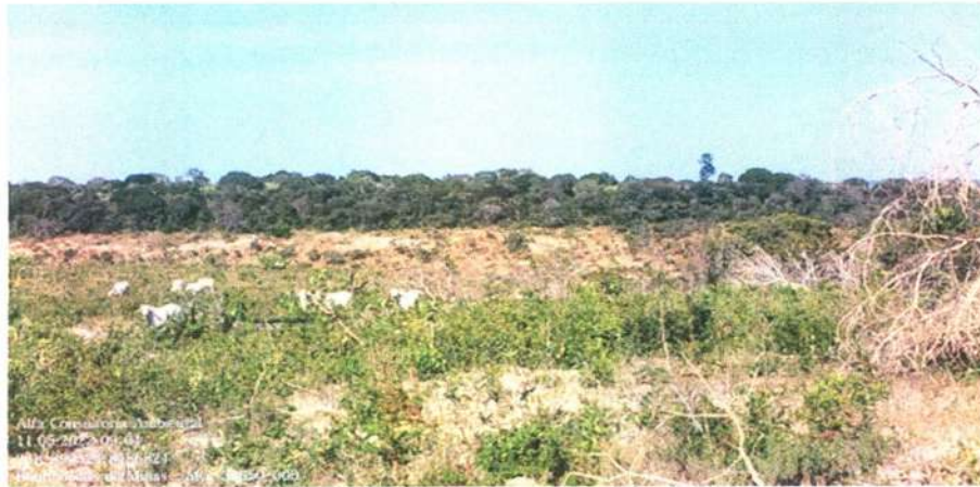
Figura 10: Bovinos presentes no local da vistoria

Em um local próximo a sede, foi encontrado vestígios da existência de uma carvoaria antiga, foram observados tijolos e solo expostos por carvão, corroborando com os relatos do proprietário que a área foi limpa há muito tempo.