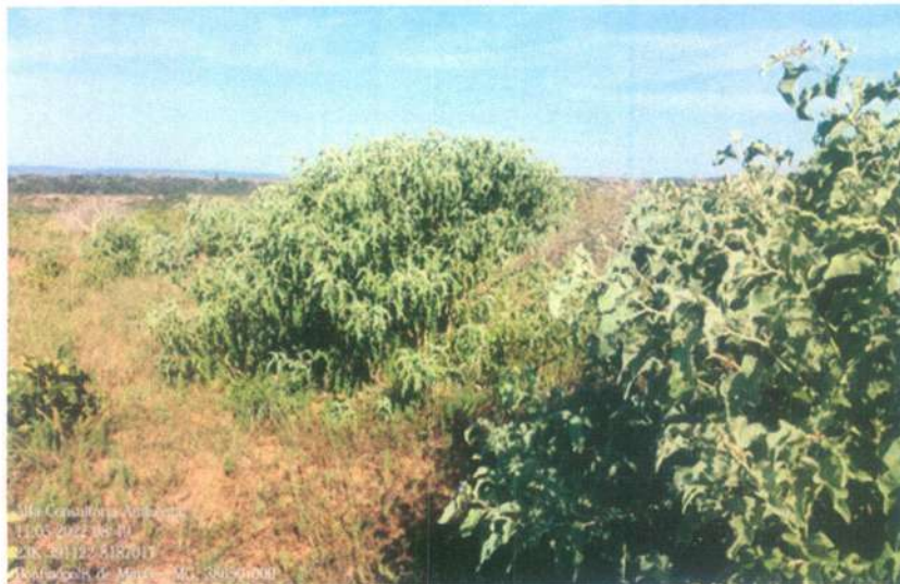
Figura 4: Presença espécies invasoras na área de pastagem

O laudo também trouxe imagens de fezes bovinas e resíduo de fornos de carvoaria, senão vejamos: