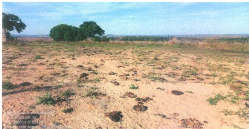
Figura 9: Presença de fezes de bovinos

É possível afirmar, a partir da constatação in loco e relato do proprietário, que a área é utilizada exclusivamente para criação de bovinos há mais de vinte anos. A seguir imagens (figura 09) das fezes dos bovinos encontrados no local que corroboram ao afirmado.