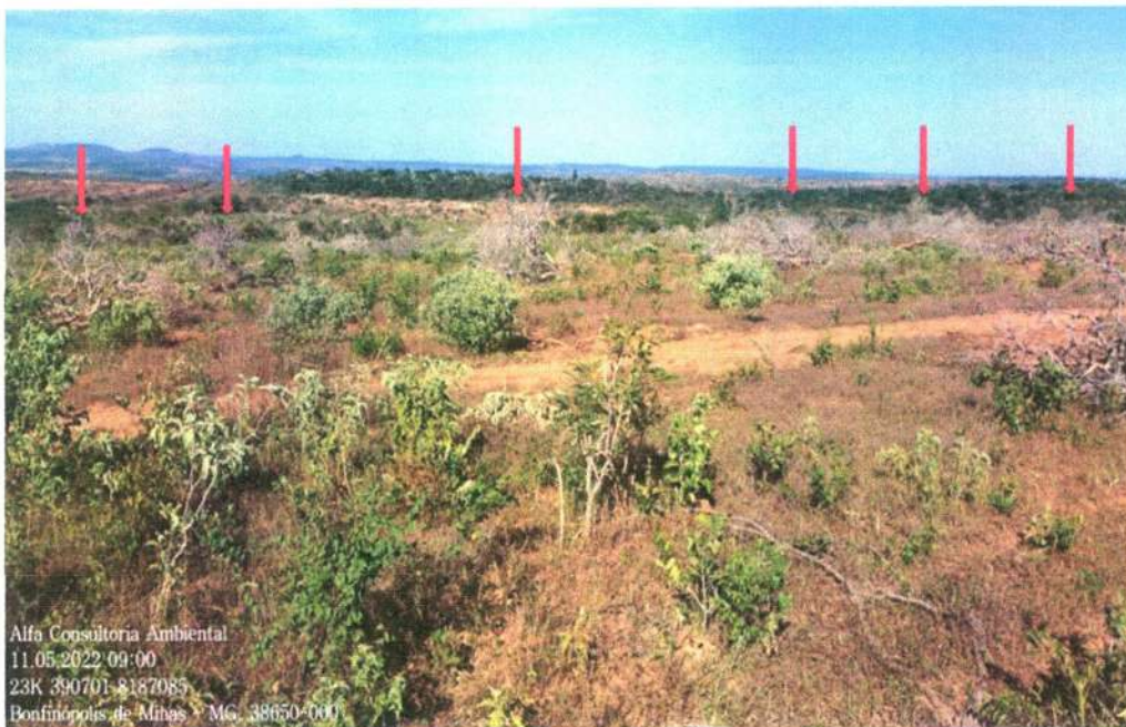
Figura 15: Árvores isoladas

Para finalizar, as imagens 15, 16 e 20 (árvores caídas) comprovam a ausência de desmate, senão vejamos: