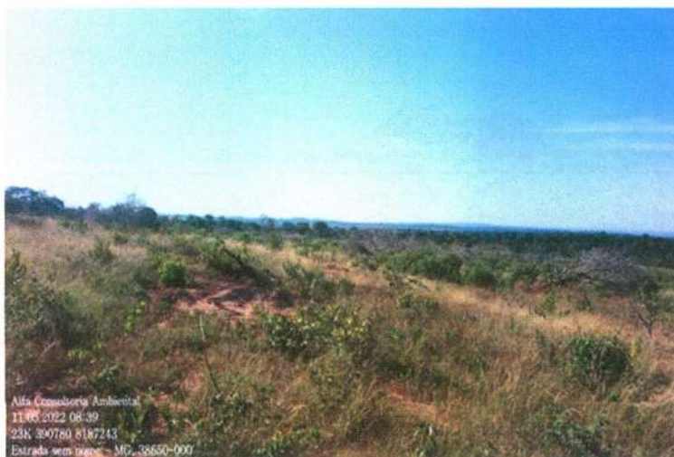
Figura 2: Presença de capim brachiaria na área de pastagem

ALFA CONSULTORIA AMBIENTAL & CIVIL Rua Álvaro Pires, nº 150 - União/MG (35) 3676-6923/99936-6611