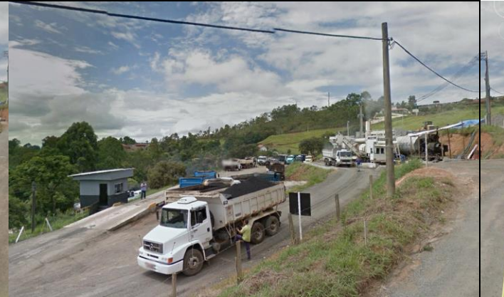
Imagem 02 - Balança