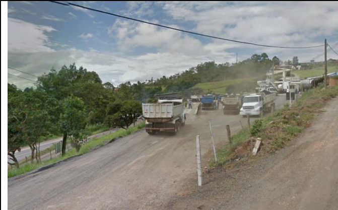
Imagem 01 – Entrada do empreendimento