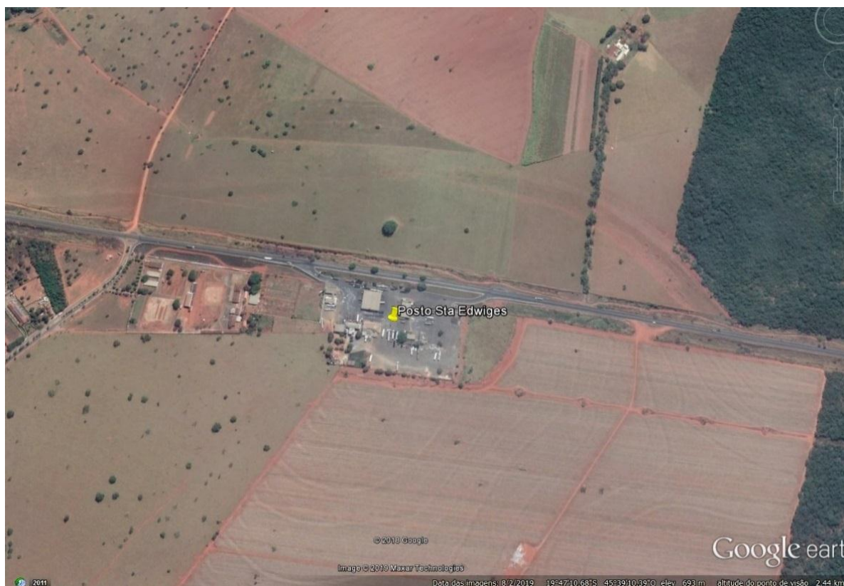
Localização do empreendimento – retirado dos estudos apresentados

O empreendimento opera suas atividades com sistema de armazenamento subterrâneo de combustíveis (SASC) no município de Luz. Localizado na Rodovia BR 262, km 523, o mesmo encontra-se instalado em zona rural.