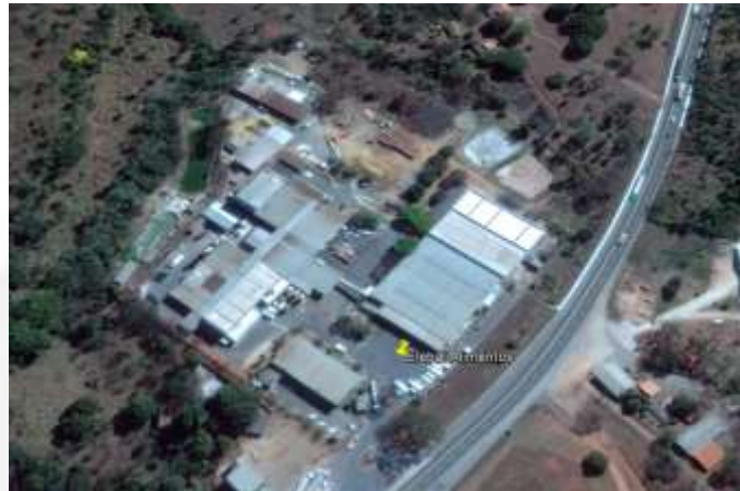
Figura 01: Imagem de satélite do empreendimento Lactalis do Brasil.

A energia elétrica utilizada pela empresa é fornecida pela CEMIG, com um consumo médio mensal de 548.533,92 kW.