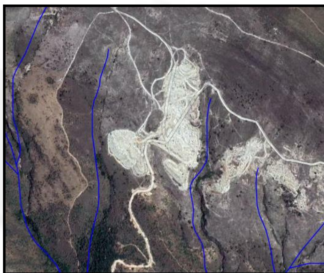
Imagem 02 – Localização do empreendimento entre duas drenagens

Foi observado pelo IDE – infraestrutura de Dados Espaciais - Sisema que a área de lava, pilha e estradas estão localizadas entre duas drenagens, conforme imagem que segue.