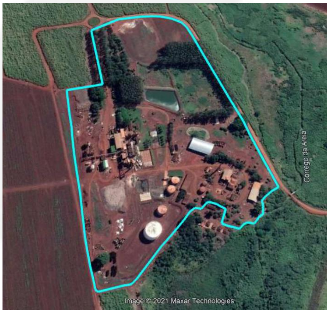
Imagem 01: Vista de satélite da área do empreendimento.

A DAMFI cogera sua própria energia elétrica, a partir da queima do bagaço de cana-de-açúcar e para isto possui dois turbo geradores, sendo que em parte da entressafra a cogeração é paralisada e utilizada energia da concessionária, CEMIG, cuja demanda contratada é de 150