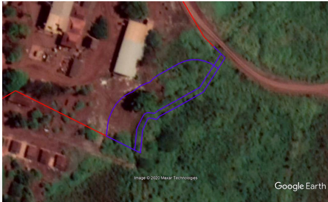
Imagem 02: Área de Preservação Permanente do empreendimento.