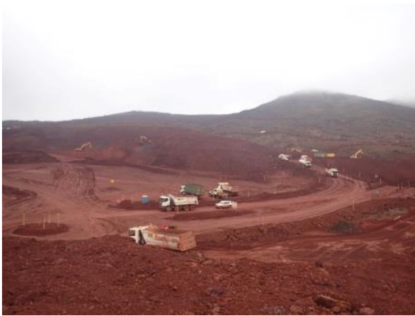
Figura 1: Obras para abertura de cava