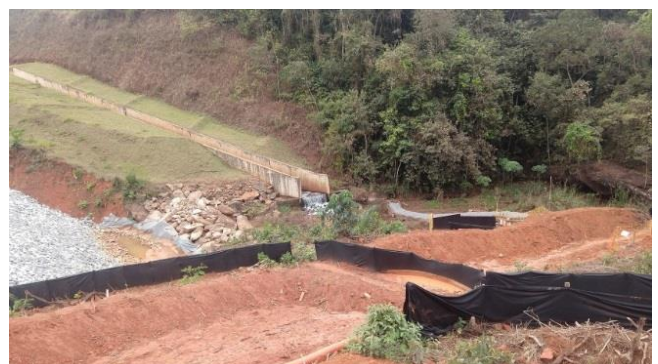
Figura 7: Medidas de controle ambiental nas áreas de obras