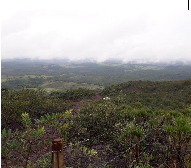
Figura 5: Área de influência da cavidade CSS-0068 cercada.