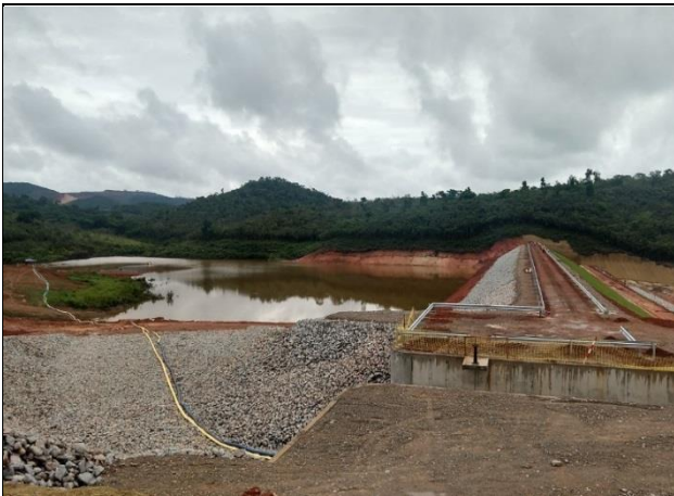
Figura 1: Vista do talude Dique 4