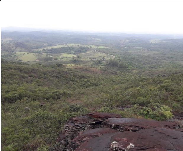
Figura 7: Vista para as áreas de influência das cavidades CSS-0095 e CSS-0096