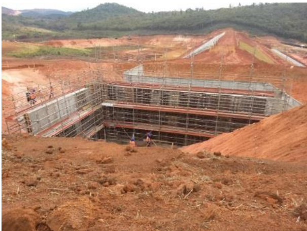
Figura 3: Obras do Dique 4