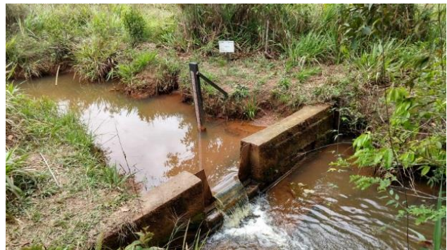
Figura 4: Régua e vertedouro para controle de vazão.