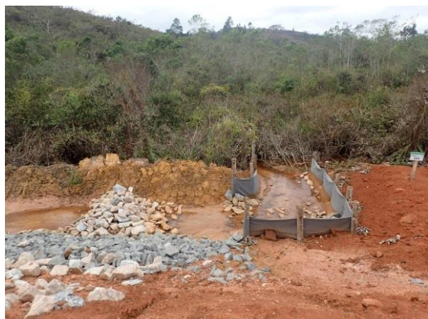
Figura 6: Medidas de controle ambiental nas áreas de obras