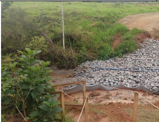
Figura 3: Fluxo residual a jusante Dique 3