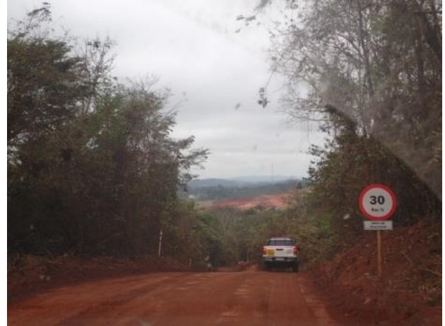
Figura 2: Estrada para acesso ao Dique 4