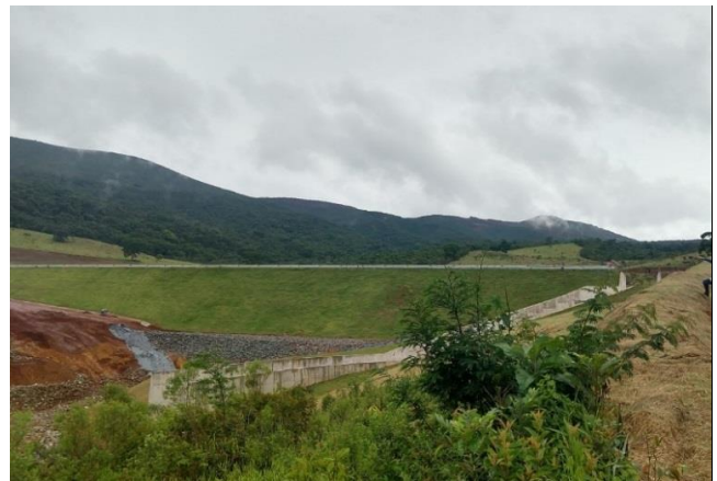
Figura 2: Vista talude Dique 3