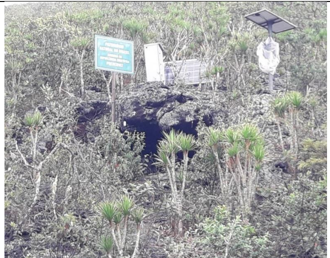
Figura 6: Entrada da CSS-0068 e placas de sinalização para proteção da caverna.