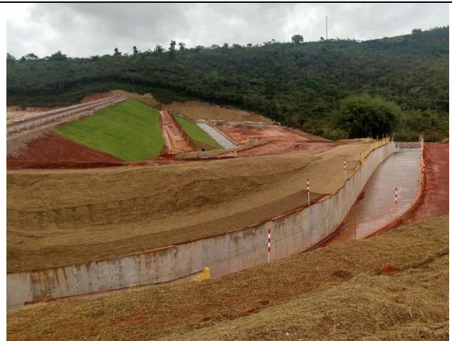
Figura 4: Fluxo residual a jusante Dique 4