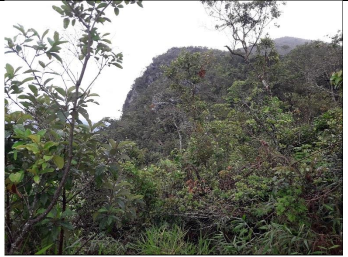
Figura 8: Vista para a área de influência da cavidade CSS-0072