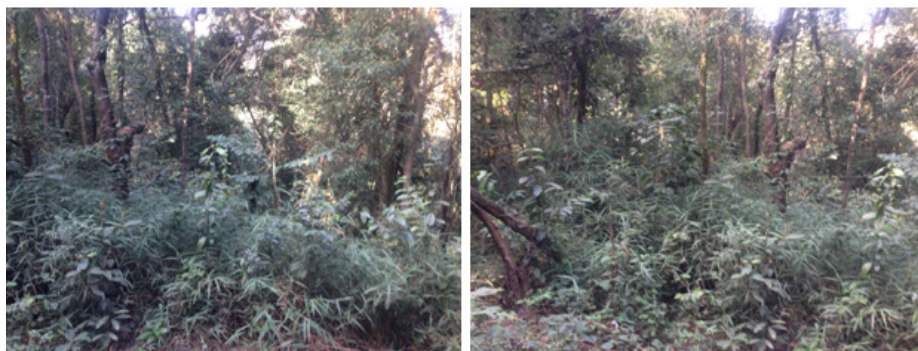
Fotos 03 e 04 - Área Propostas para compensação.