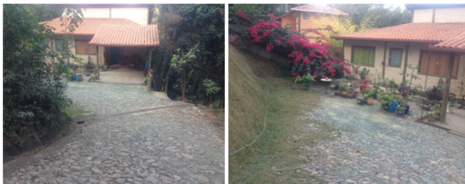
Foto 01 e 02 - Acesso e residência