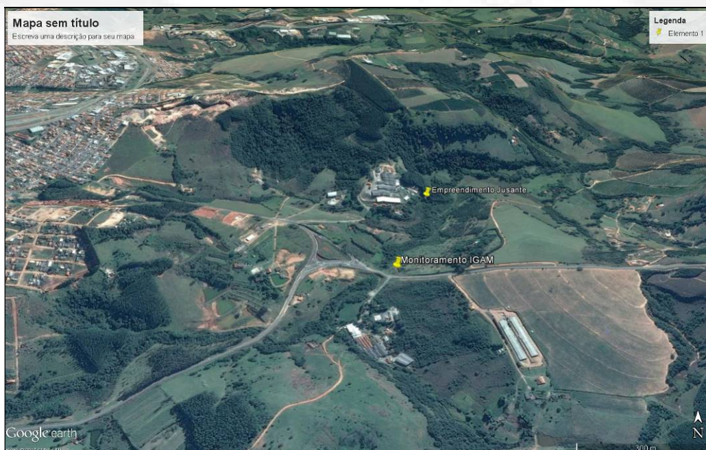
Figura 07: Monitoramento IGAM e Curtume Cacique

A Figura 07 permite visualizar o ponto de monitoramento do IGAM para o Córrego Liso, a jusante da cidade de São Sebastião do Paraíso e a montante do empreendimento Curtume Cacique, bem como o ponto de automonitoramento realizado pelo próprio empreendimento durante a Licença de Operação a jusante de seu lançamento.