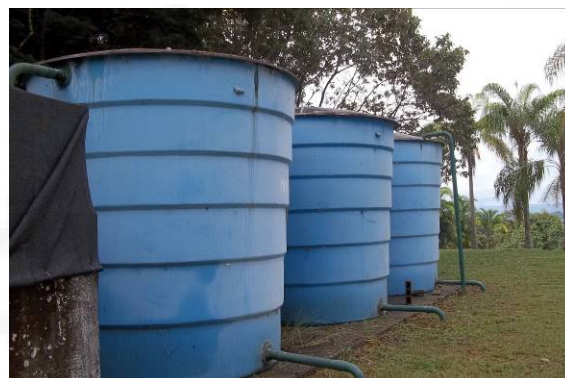
Foto 08. Caixas d'águas secundárias