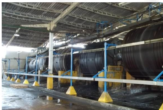
Foto 02. Fulões.