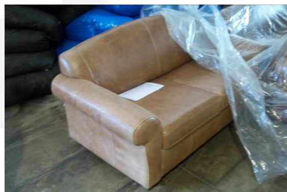
Foto 10. Estofados.