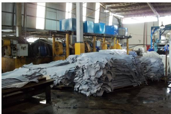
Foto 01. Wet Blue produzido.