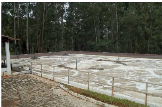
Foto 05. Aeração da ETE Industrial.