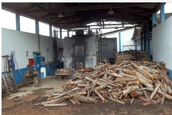
Foto 03. Caldeiras a lenha.