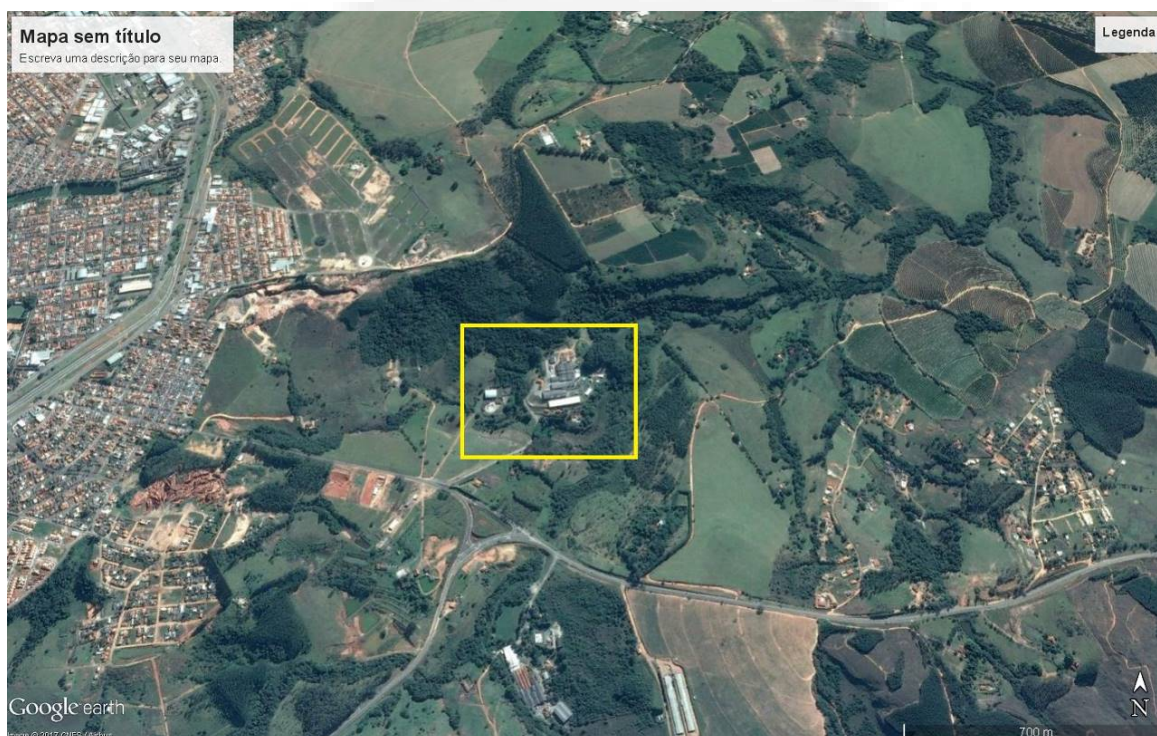
Figura 01: Imagem de satélite do Curtume Cacique e seu entorno.

A Figura 01 abaixo permite visualizar a localização do empreendimento e a configuração de seu entorno.