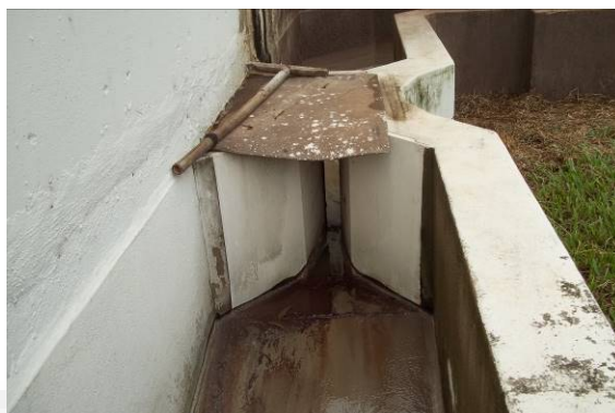
Foto 06. Ponto de lançamento efluente.