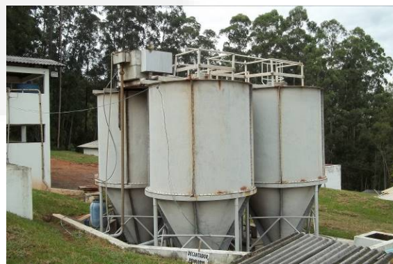
Foto 04. Tanques de precipitação da ETE.