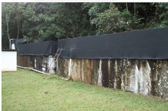
Foto 07. Caixa d'água principal.