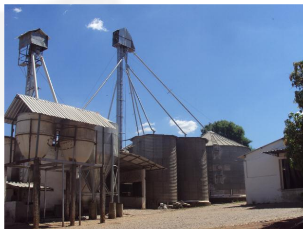
Foto 04. Silos de produção de ração