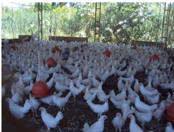
Foto 05. Galpões de recria