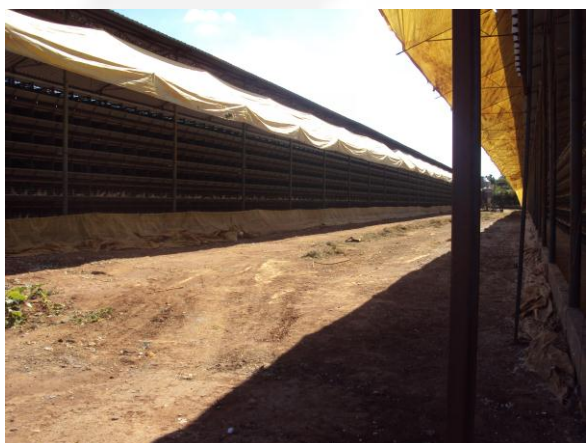
Foto 07. Área Externa do galpão de postura