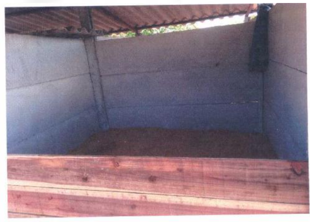
Foto 12. Composteira