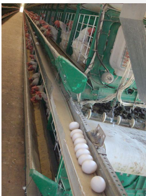
Foto 1. Coleta automática de ovos