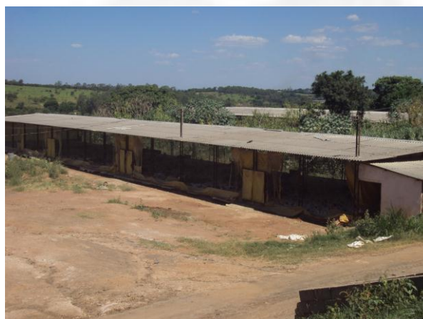
Foto 08. Área externa ao galpão de recria