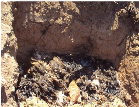
Foto 11. Vala de queima de frangos mortos