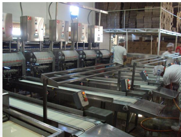
Foto 06. Máquina de classificação de ovos