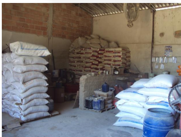
Foto 03. Armazenamento de materiais