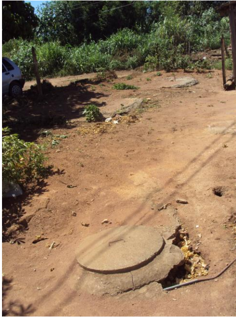
Foto 09. Fossa séptica