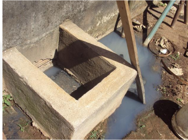
Foto 10. Água proveniente da máquina de classificação de ovos