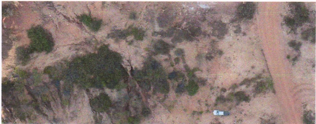
Figura 1: FOTOGRAFIA DO LOCAL, DEZEMBRO 2018.

Para sanar as dúvidas, a empresa realizou no local um levantamento aerofotogramétrico no local, onde usando um drone, fez fotografias aéreas (Figura 1) do local para esclarecer os fatos descritos acima.