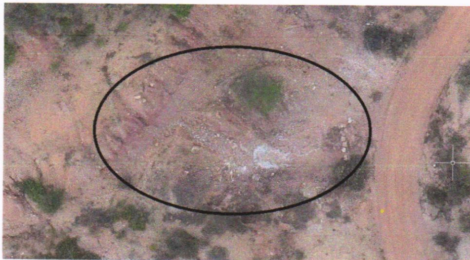
Figura 2: FOTOGRAFIA DO LOCAL, DEZEMBRO 2018.

Pode-se observar que a vegetação arbustiva, cresceu no local que ainda é caracterizado por presença de erosões e solo exposto. Isso demonstra que a atividade no local não é de grande impacto, visto que o local já foi alvo de uma lavra pretérita. (Figura 2 e 3)