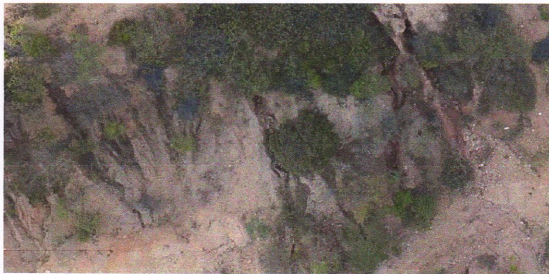
Figura 3: FOTOGRAFIA DO LOCAL, DEZEMBRO 2018.

O material no local está aflorado, já foi removida a vegetação e parte do solo pela antiga empresa que explorou o local, facilitando a extração atual. Vale salientar ainda que durante o processo de exploração da antiga empresa, talvez não existisse a tecnologia e maquinário apropriado para se realizar uma exploração mais racional e maximizando o aproveitamento no minério que existe no local.