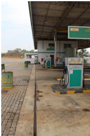
Foto 2: Pátio de Estacionamento