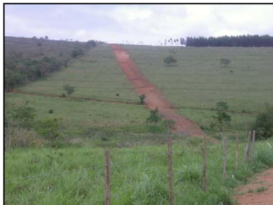
Foto 01. Traçado original onde passará Gasoduto.