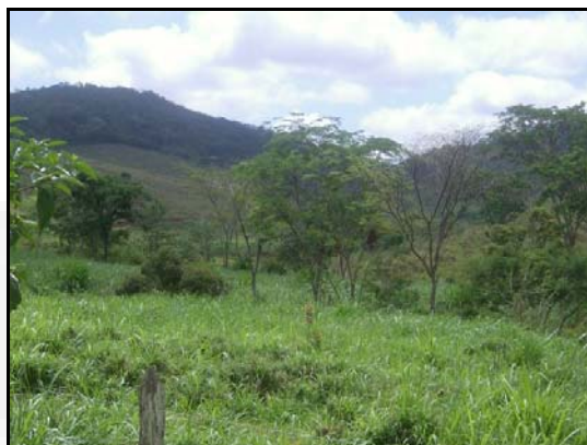
Foto 02. Início do novo trecho de Intervenção.