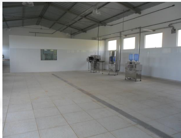
Foto 02. Galpão de lavagem/envase