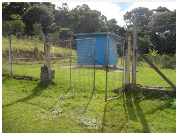
Foto 01. Casa de proteção da fonte