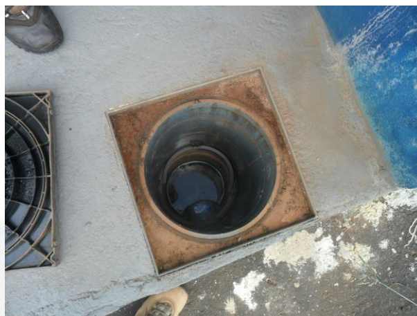
Foto 06. Sistema de gradeamento para efluentes industriais.