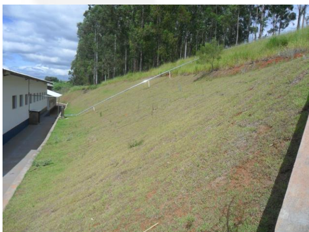
Foto 03. Taludes