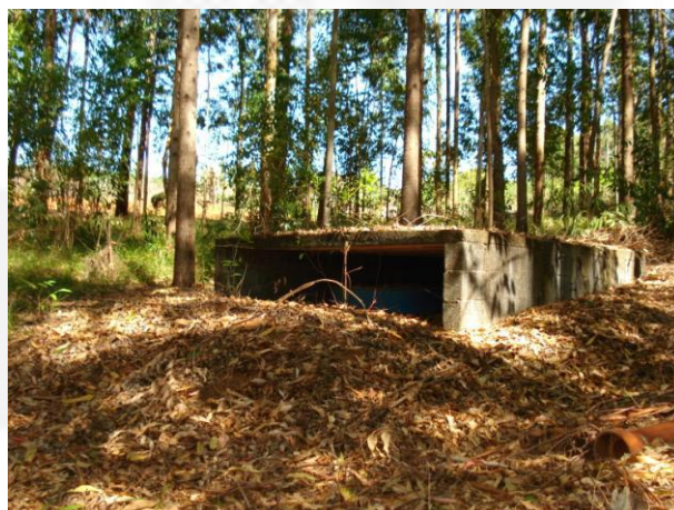
Foto 04. Fossa séptica e sumidouro.