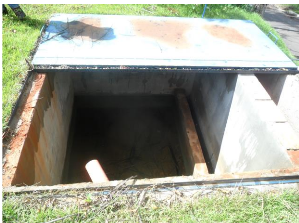
Foto 05. Caixa de equalização de efluentes industriais