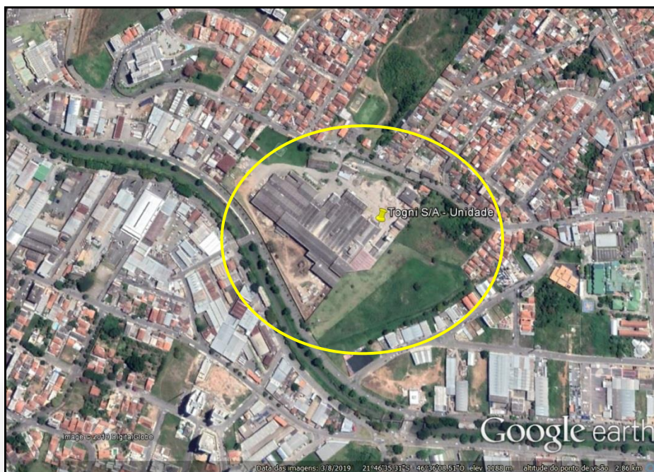
Figura 1 – Imagem aérea da Togni S.A. Materiais Refratários - Unidade I.

O processo produtivo do empreendimento inicia-se com o recebimento do chamote (argila calcinada) em big bags para posterior britagem. O material britado é retomado por elevador de canecas e encaminhado através de correias transportadoras para baias de estocagem temporária.