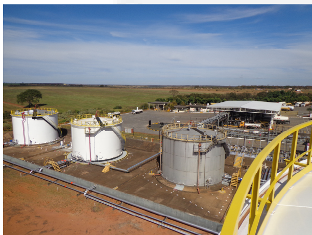
Foto 01. Vista parcial do empreendimento.