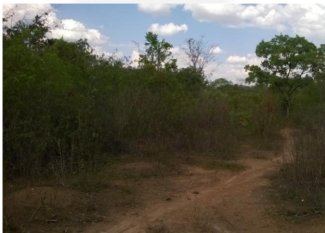
Foto 01. Área proposta para implantação da ETE

Empreendedor: Estação de Tratamento de Efluentes – ETE Matadouro Empreendimento: Serviço Autônomo de Água e Esgoto – SAAE Sete Lagoas CNPJ: 24.996.845/0001-47 Município: Sete Lagoas Atividade: Tratamento de esgoto sanitário Código DN 74/04: E-03-06-9 Responsabilidade pelos Estudos: Bio Alternativa Consultoria Ambiental Referência: Licença de Instalação – LI Processo: 12661/2006/002/2015 Validade: 06 (seis) anos