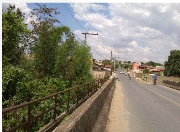
Foto 04. Ponte sobre o Córrego do Diogo, uma das áreas que receberão interceptores de esgoto.