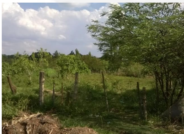
Foto 03. Área de implantação de uma das EEE