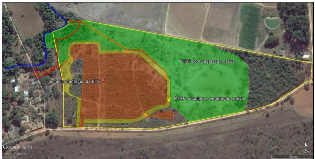
Figura 01 – Localização das áreas para implantação das estruturas de ETE.

Este projeto prevê a recomposição de vegetação em APP e outras áreas nos arredores do local a ser instalada a ETE em um quantitativo de 2,64 hectares (Figura 01).