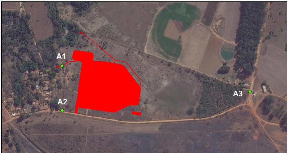
Figura 2 - Localização dos pontos de monitoramento de ruído durante a operação da ETE.

A figura abaixo mostra os pontos de monitoramento de ruídos na fase do operação da ETE (Figura 2).