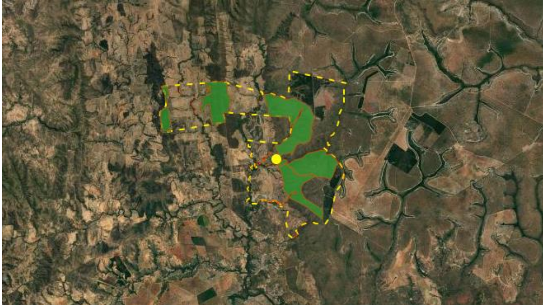
Figura 3. Reserva Legal averbada e declarada no CAR, acesso em 29/11/2023

Foi apresentado Projeto Técnico de Reconstituição da Flora - PTRF – para as áreas de APP, totalizando 18,0241ha, que se encontram antropizadas. A proposta apresentada é a recuperação por reconstituição de flora. A implantação da área recomposta de APP será totalizada em 36 meses, esperando-se anualmente a reconstituição de 33% da necessidade.