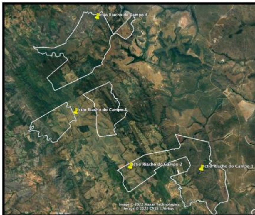
Figura 1. Localização do empreendimento e mapa da área do empreendimento.

O acesso à Fazenda Riacho do Campo, Matinha e Retiro, Terra Vermelha, Bocaina e Mata, lugar denominado Riacho do Campo, é através da Rod. Brasilândia de Minas sentido Santa Fé por 20,5 km virar à esquerda, percorrer por 6,8 km virar à esquerda, mais 3,4 km virar à direita, mais 4,8 km até a entrada da fazenda.