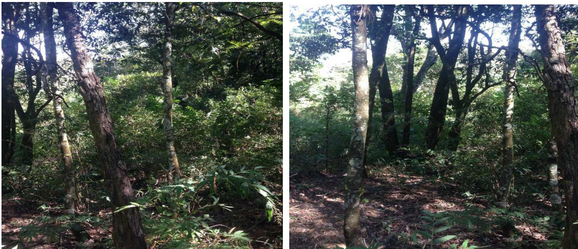
Fotos 03 e 04- Área proposta para compensação.

A área onde ocorrerá a compensação florestal será na própria propriedade, sendo assim, as características ambientais são aquelas informadas na caracterização da área de intervenção. O referido fragmento se apresenta de forma adensada, conforme Fotos 3 e 4 .