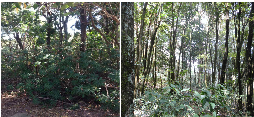
Fotos 01 e 02 - Área de intervenção.