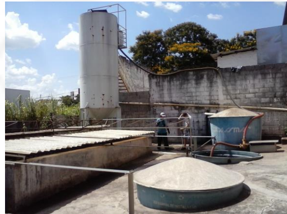
Foto 4: Estação de tratamento de efluentes industriais – chegada do efluente, tratamento físico-químico e leito de secagem do lodo