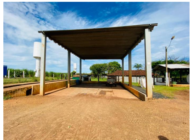
Foto 04. Local para lavagem de maquinário/veículos