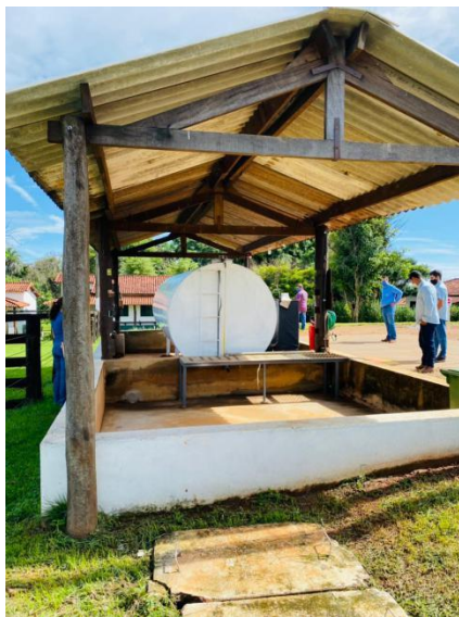
Foto 03. Posto de combustíveis