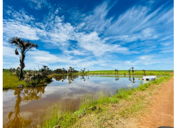
Foto 02. Barramento