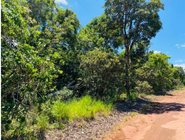
Foto 01. Reserva legal.