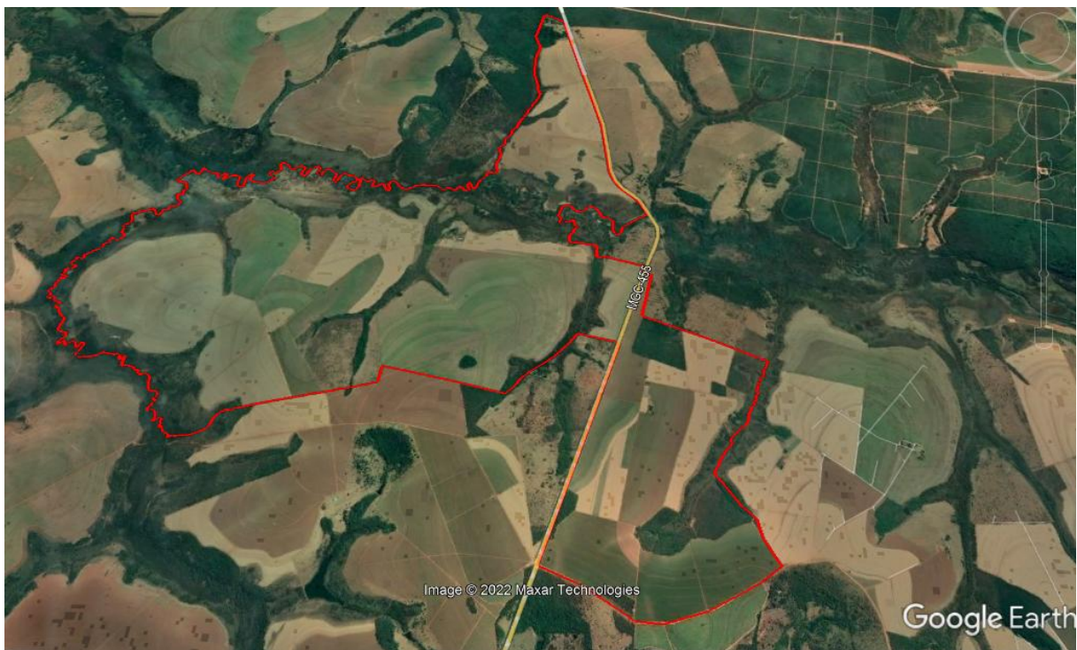
Figura 1. Localização da Fazenda São Jorge, Santa Fé e São Bento.

O empreendimento Fazenda São Jorge, Santa Fé e São Bento está situado na zona rural do município de Uberlândia/MG, tendo como referência o ponto com as seguintes coordenadas geográficas: DATUM WGS 84: 19°20'32,6" S e 48°26'51,2" O (Figura 1).