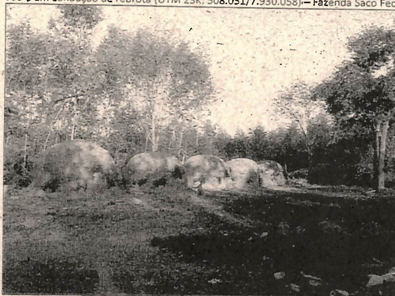
Vista parcial da Carvoaria (06 Fornos) - Fazenda Saco Fechado e Poções.