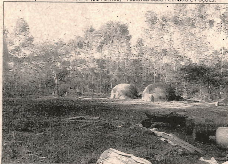
Vista parcial da Carvoaria (03 Fornos) - Fazenda Saco Fechado e Poções.