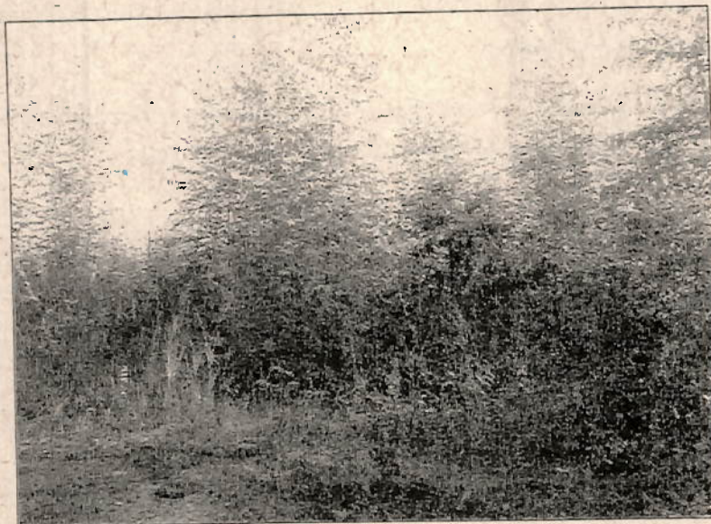
Área já explorada e em condução de rebrota (UTM 23K: 508.107/7.929.986) – Fazenda Saco Fechado e Poções.