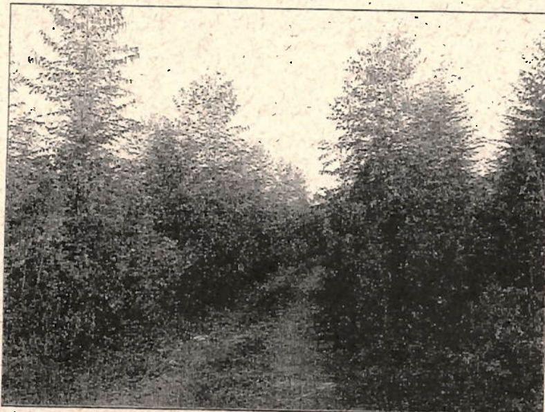
Área já explorada e em condução de rebrota (UTM 23K: 508.051/7.930.058)— Fazenda Saco Fechado e Poções.