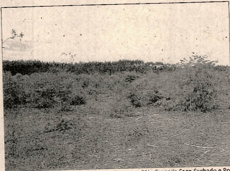
Área de 4,0 ha já explorada (Conforme Imagem 01 acima – pg. 01) - Fazenda Saco Fechado e Poções – Data da Imagem: 28/08/2018.