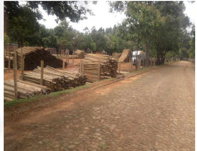
Foto 06. Pátio de armazenamento de madeira tratada