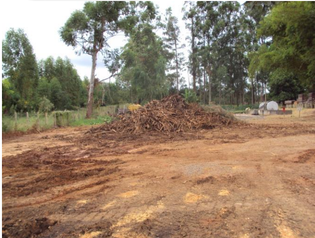
Foto 07. Área de armazenamento das cascas