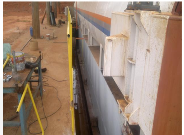
Foto 04. Autoclave com canaletas para recirculação do efluente