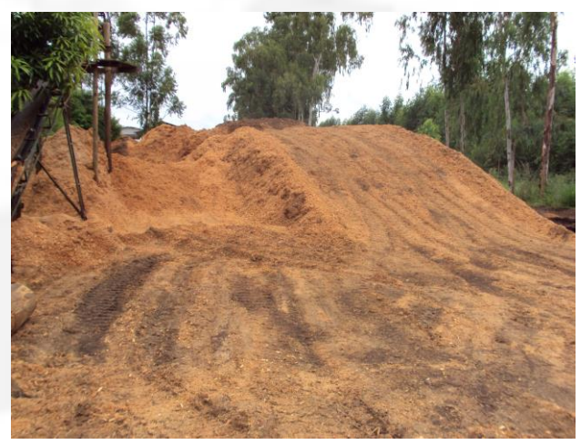
Foto 08. Área de armazenamento de serragem