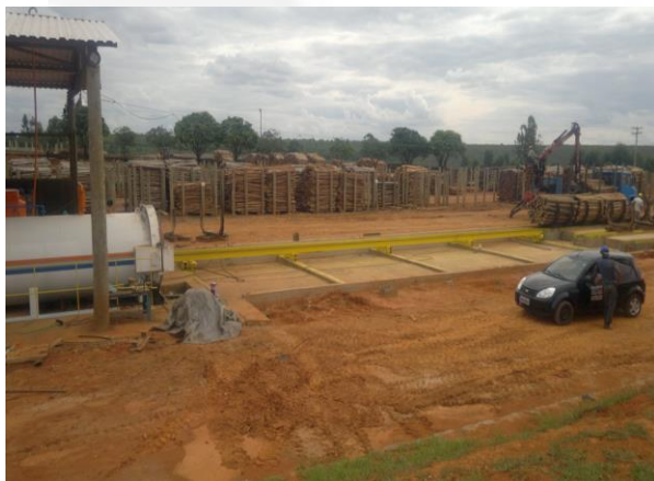
Foto 03. Área de tratamento da madeira