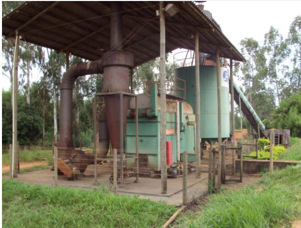
Foto 01. Gerador de água quente