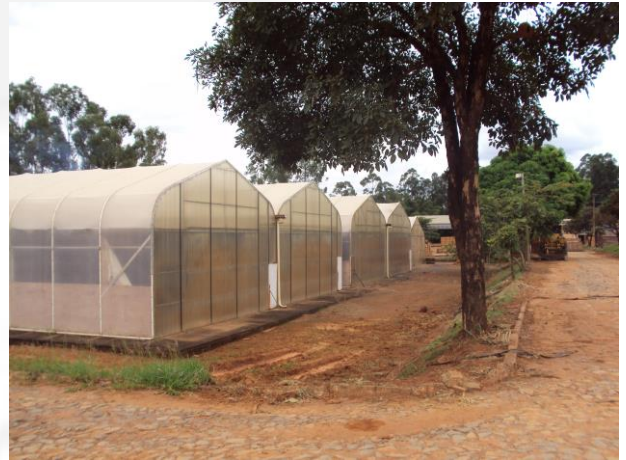
Foto 02. Estufas solares