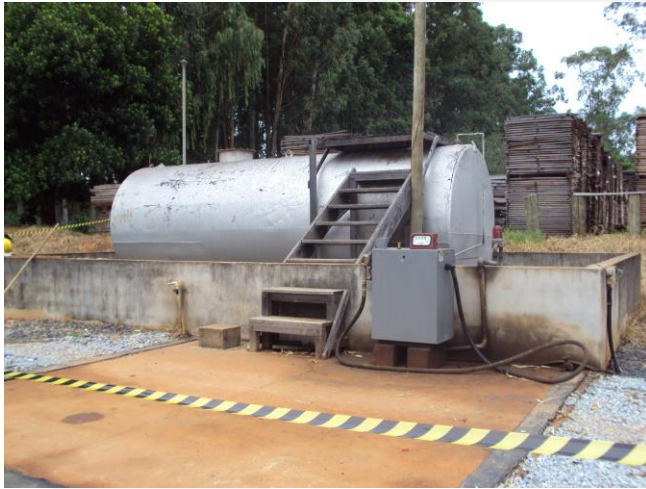
Foto 05. Posto de abastecimento