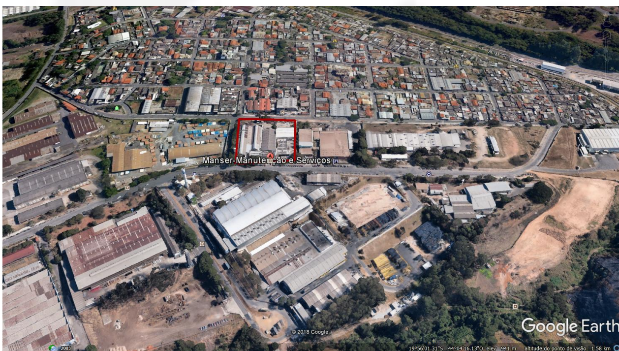
Figura 01: Localização do empreendimento Manser Manutenção e Serviços Ltda.

A empresa Manser Manutenção e Serviços Ltda. localiza-se à Rua Américo Santiago nº 640, bairro Cinco, área urbana do município de Contagem, conforme Figura 01: