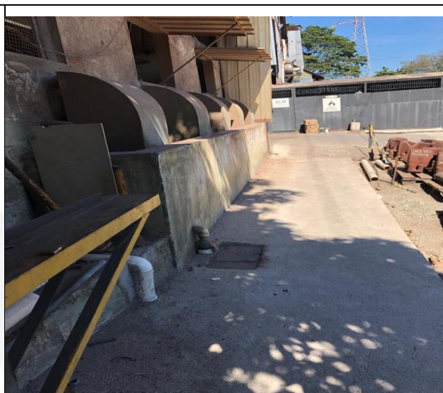
Foto 08. Cortina d'água presente no exaustor da unidade de remoção de resíduos de resinas.