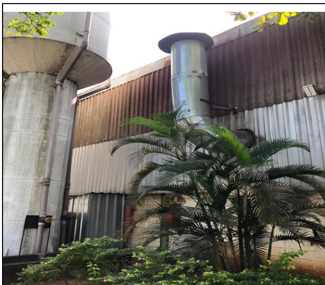
Foto 07. Chaminé de exaustão da cabine de pintura.