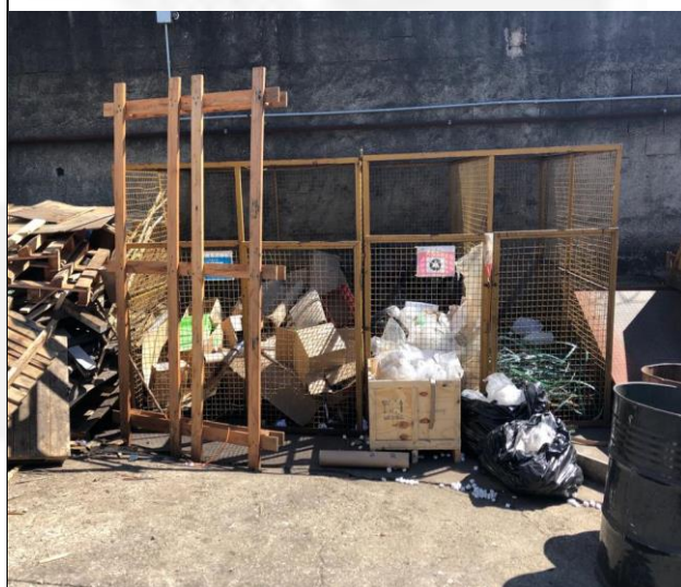
Foto 04. Área de armazenamento de resíduos sólidos identificado na ocasião da vistoria.