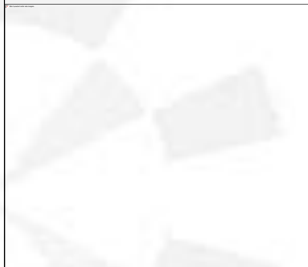
Foto 06. Uma das cabines de pintura existente. Aos fundos o lavador de gases tipo cortina d'água.

Foto 05. Saída da Caixa Separadora de Água e Óleo – CSAO.