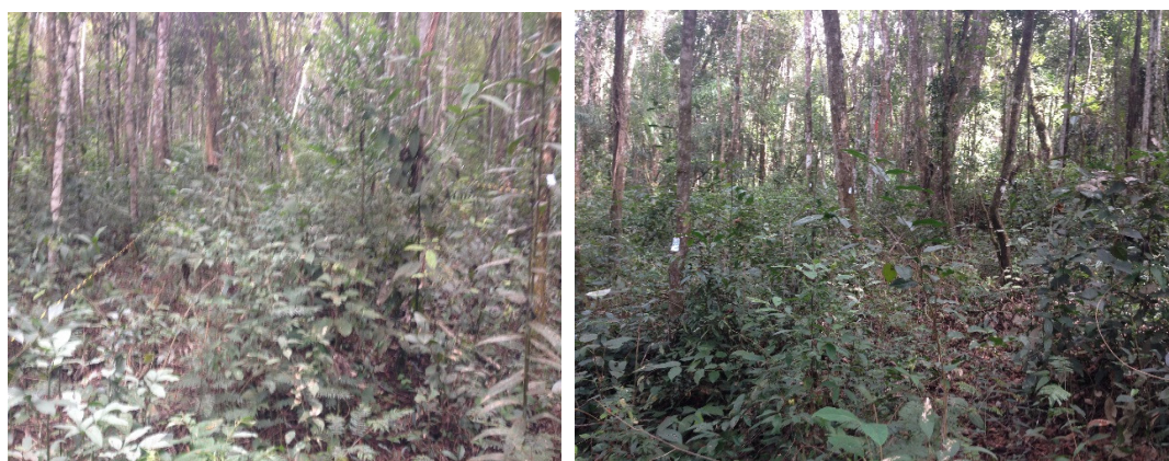
Fotos de 01 e 02 –Área de Intervenção– acesso e edificação. Fonte FECF 2017

Com relação à fauna, foi observada e relatada a presença de animais com grande facilidade de adaptação em áreas alteradas. No grupo da mastofauna, foi relatada a presença de vestígios de alguns animais, como é o caso do abrigo do tatu ( Euphractus sexcinctus ). No grupo da avifauna foi evidenciada a presença de diversas espécies, como o João de barro ( Furnarius rufus ), Rolinha-fogo-apagou ( Columbina squammata ), Carcará ( Caracara plancus ) e João graveteiro ( Phacellodomus rufifrons ). Já o grupo da herpetofauna, foi representado pelas espécies: Tropidurus torquatus (Calango) e Tupinambis teguixius (Lagarto teiú). Não se verificou nesse terreno a presença de espécies vegetais endêmicas e imunes, em porte que permita sua identificação. Não foram registradas espécies arbóreas ou arbustivas em risco de extinção, segundo a lista vermelha Biodiversitas. A supressão solicitada não foi realizada, uma vez que o empreendimento encontra-se ainda em fase de análise junto ao órgão estadual.