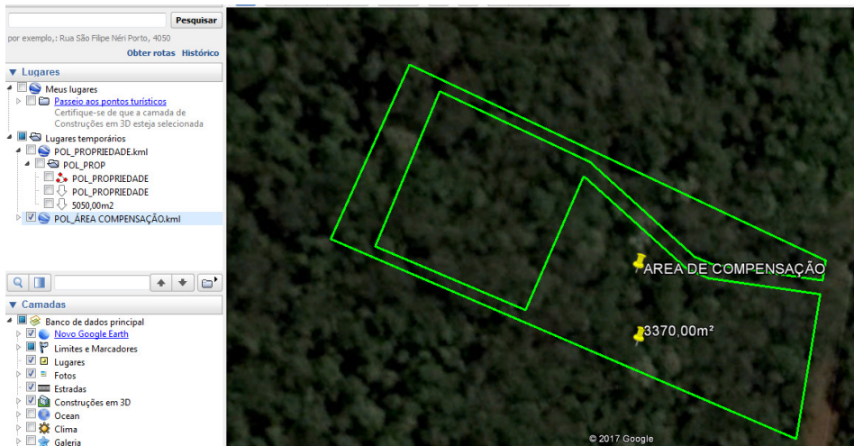
Figura 2. Imagem satélite, poligonal da área intervinda e compensação.