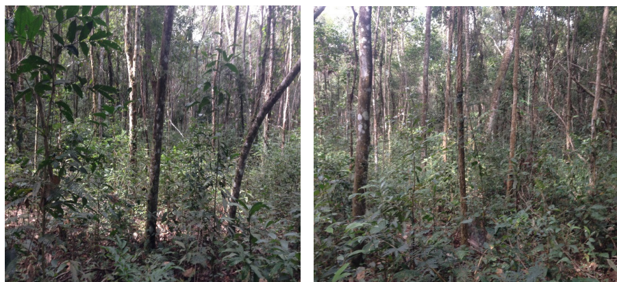
Fotos 05 e 06 - Ilustra a Área proposta para compensação.

A área foi vistoriada para verificação da extensão, localização, equivalência ecológica com a área suprimida, bem como outros aspectos inerentes à modalidade de compensação proposta. Acrescenta-se que os pontos vistoriados foram definidos com base na análise de imagens satélite do polígono encaminhado pelo empreendedor. Na seleção de pontos buscou-se amostrar