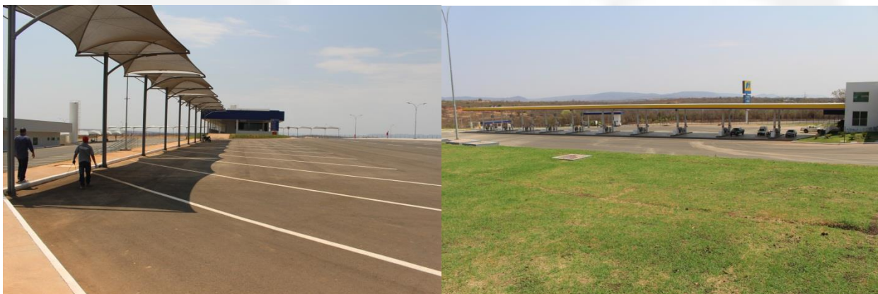
Foto 03 – área de estacionamento de veículos Foto 04 – taludes com vegetação - gramíneas