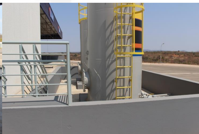
Foto 19 e 20 – área coberta para troca de óleo, com piso concretado com canaletas ligadas ao SSAO, e dois tanques aéreos de capacidade de armazenamento de 10 m 3 cada de óleo para motor; sendo que os tanques aéreos estão dentro de uma bacia de contenção de concreto e com canaletas ligadas ao SSAO;