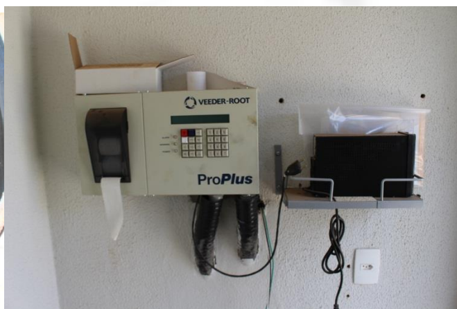
Foto 26 e 27 – tanques de combustíveis de parede dupla, com bocas de visitas com sump e monitoramento intersticial instalado (veeder-root);