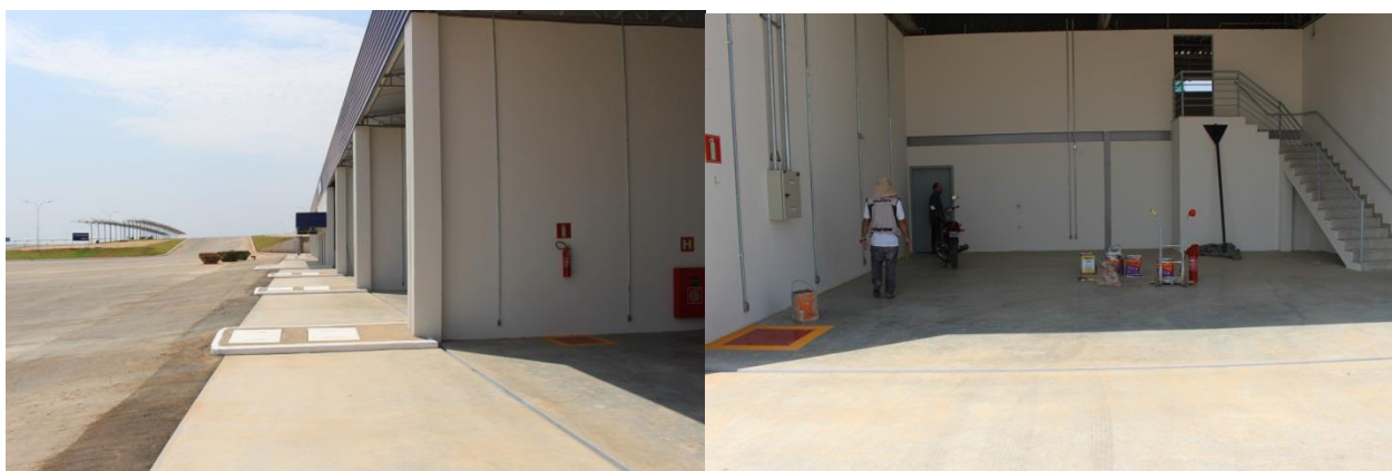
Foto 05 e 06 – área para aluguel de oficinas e revenda de peças automotivas – área coberta com piso concretado, canaletas interligadas ao SSAO;