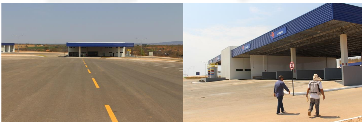
Foto 07 e 08 da área de troca de óleo e lavagem de veículos com piso concretado, canaletas ligadas ao SSAO;