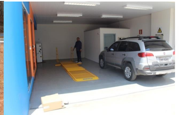
Foto 32 – poço tubular com hidrômetro e laje de proteção Foto 33 – área de troca de óleo veículos pequenos e no local o veeder-root (monitoramento intersticial) dos tanque de parede dupla da pista de abastecimento dos combustíveis gasolina e álcool.