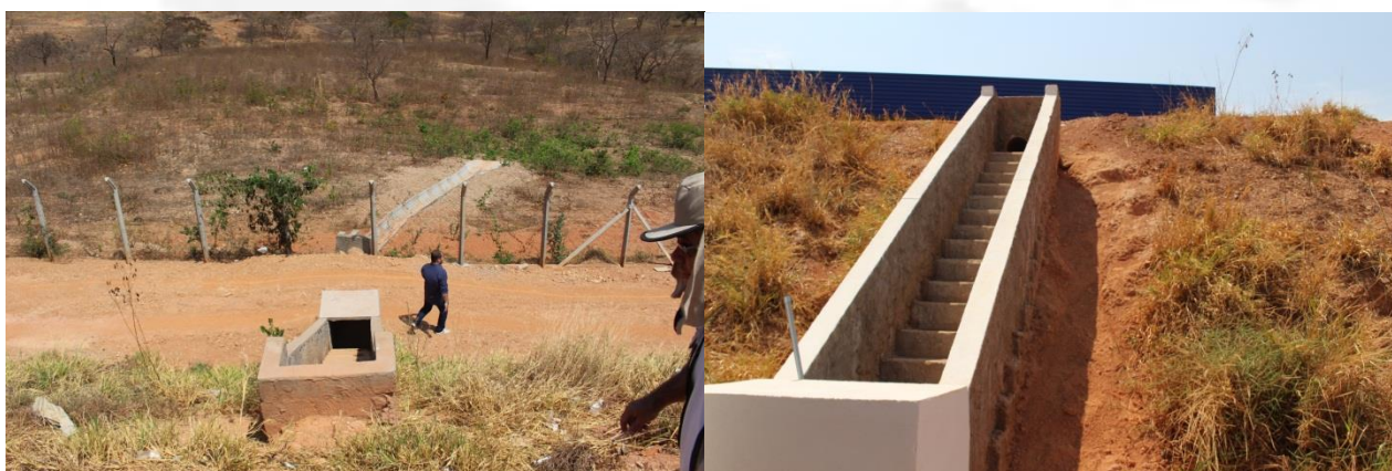
Foto 09 e 10 – sistema de drenagem de água pluvial com escadas de dissipação de energia;