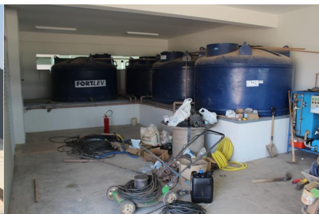
Foto 17 e 18 – área de lavagem de veículos e sistema de tratamento da água para reuso d'água para lavagem de veículos