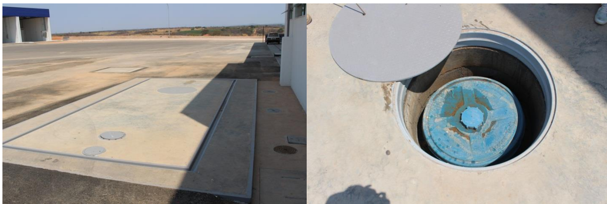
Foto 22 e 23 – tanque subterrâneo com capacidade de 15 m 3 para estocagem de óleo usado – este tanque contém boca de visita com sump;