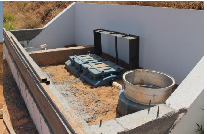
Foto 11 e 12 caixas separadoras de água e óleo – reservatório de concreto de 200 m 3 para reaproveitamento de água pluvial e de água tratada dos SSAO