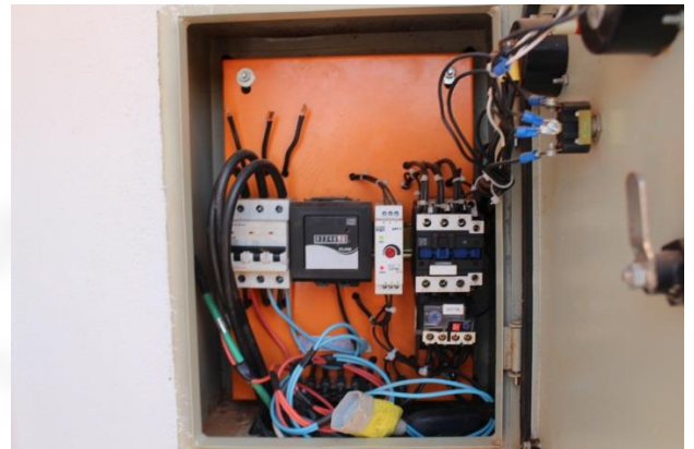
Foto 13 e 14 – instalação do hidrômetro e horímetro do poço tubular – com laje de proteção sanitária