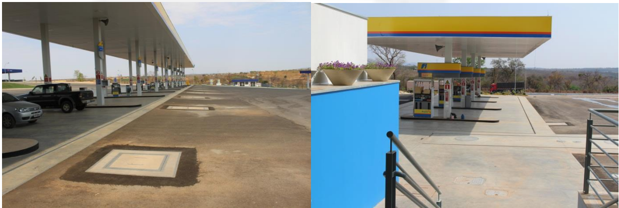
Foto 01 e 02 – pistas de abastecimentos de Diesel e Gasolina/Álcool com piso concretado, com canaletas abaixo da projeção do telhado, ligadas ao SSAO (sistema separador de água e óleo);