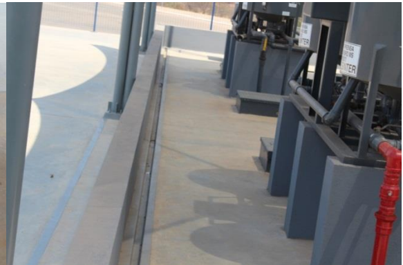
Foto 28 – bombas com sump e check- válvula Foto 29 – bateria de filtros de óleo em uma bacia de contenção dom canaletas ligadas ao SSAO;