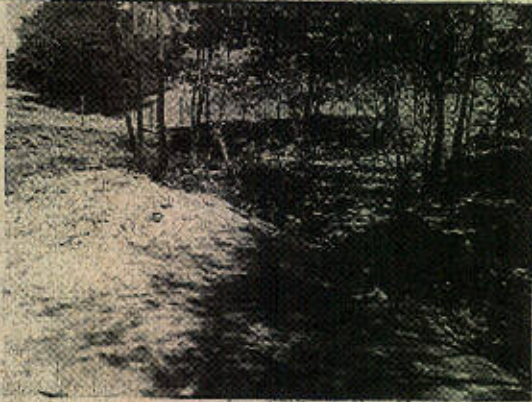
Foto 7: Córrego de água proveniente de nascente chegando em pequeno barramento.