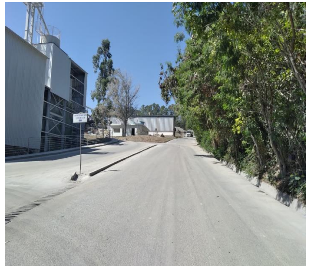
Foto 04 Via asfaltada e cinturão verde