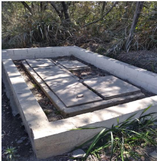
Foto 03 ETE- Fossa Séptica