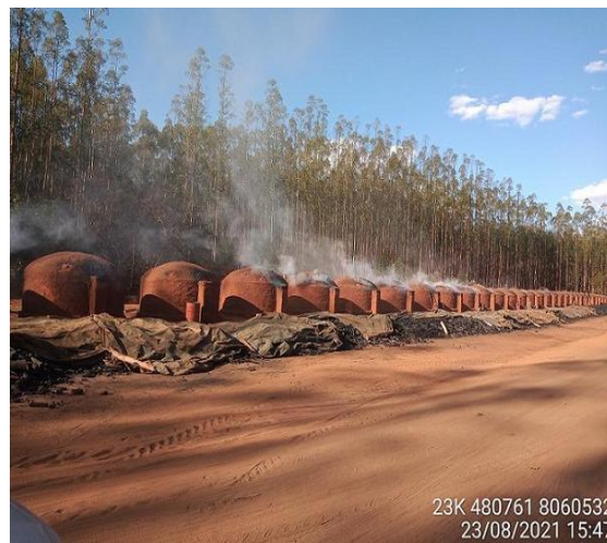
Praça de Carbonização