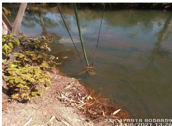
Captação Rio Formoso