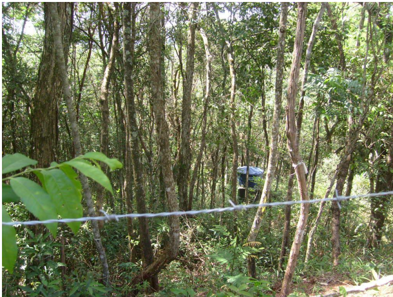
Fotos 1 e 2 – Área requerida para intervenção. Nesse local nota-se a formação definida em dois estratos: dossel e sub-bosque, e presença de cipos e clareiras.

Para balizar a intervenção ambiental (supressão de vegetação), que ainda não foi realizada, é apresentada a poligonal de área intervinda, com demarcação da área de preservação e compensação confeccionada em datum SIRGAS 2000 e no sistema de coordenadas Lat./Long., conforme orientação do Termo de Referência do Anexo II da Portaria IEF nº 30/2015.