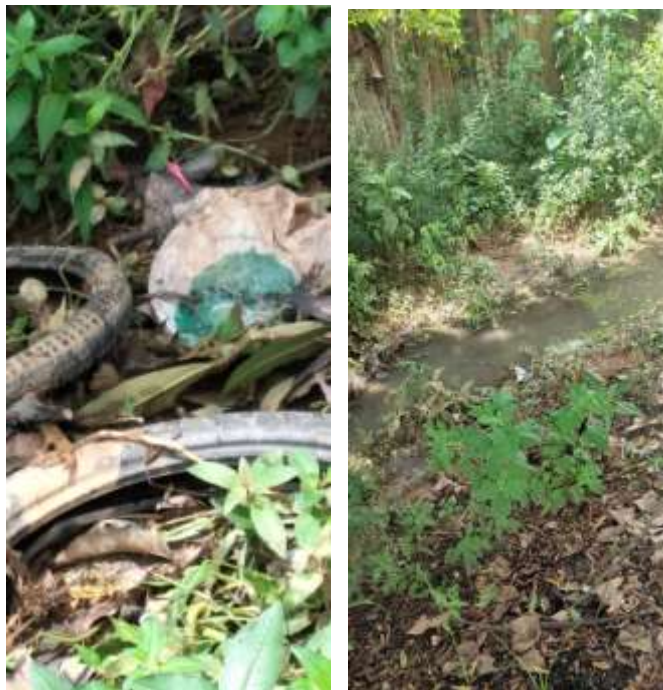
Lixo e esgoto a céu aberto.