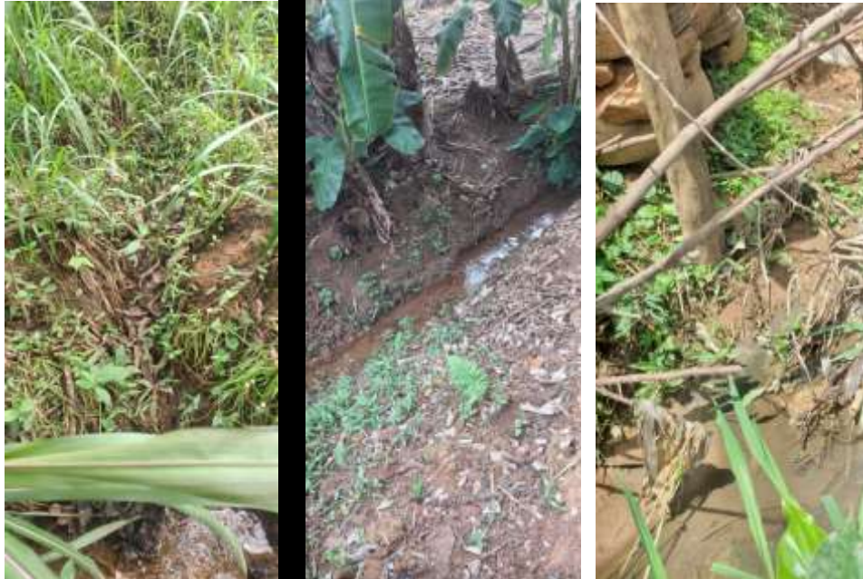
Córrego do Sossego

ASSOCIAÇÃO PRÓ POUSO ALEGRE – APPA CNPJ nº 08.218.454/0001-45 - IE: Isento - ONG fundada em 15/06/2006 SECRETARIA: Rua Cel. José Gonçalves D`Amarante, nº 56 – Centro – Fones: 37.99923.8122 / 98846.3956 / 99828.6669 E-Mail: pajo121@yahoo.com.br – CEP 35570-146 - Formiga – MG