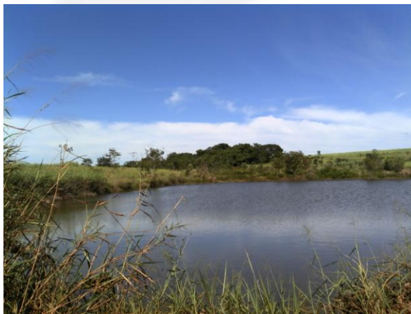
Figura 1. Barramento