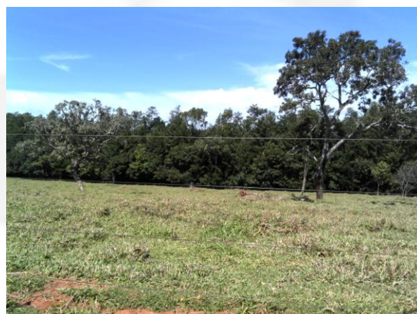
Figura 4. Reserva legal