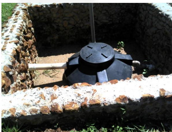
Figura 3. Fossa séptica