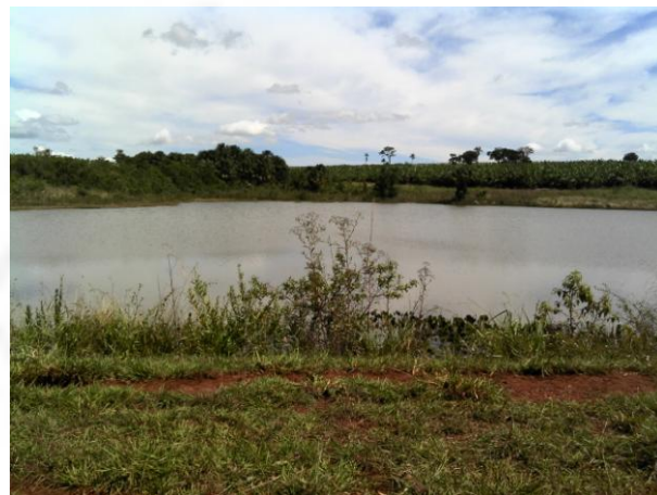
Figura 2. Barramento