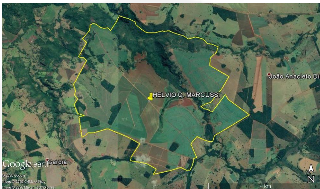
Figura 1. Vista aérea da propriedade (área aproximada)

O empreendimento, constituído pelas Fazendas São Francisco e Sucuri (matrículas 15.164 e 15.275), está localizado na zona rural do município de Monte Alegre de Minas/MG e apresenta como pontos de referência as coordenadas geográficas WGS 84: 18°33'32.54" S. e 49°0'26.75" W. (FIGURA 1).