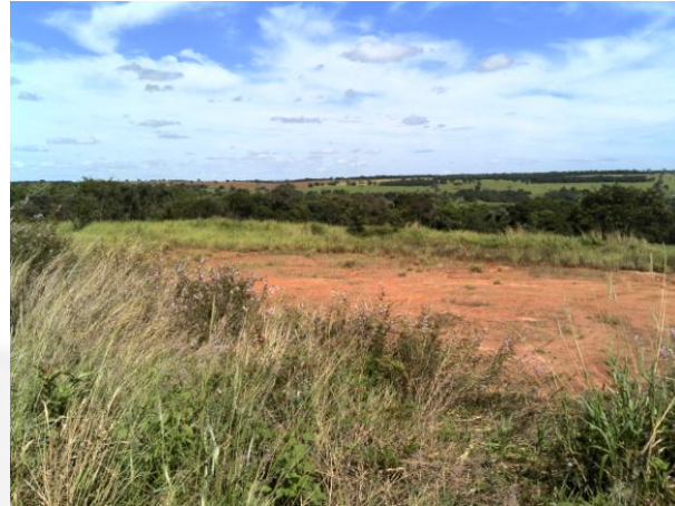
Figura 6. Área de cascalheira