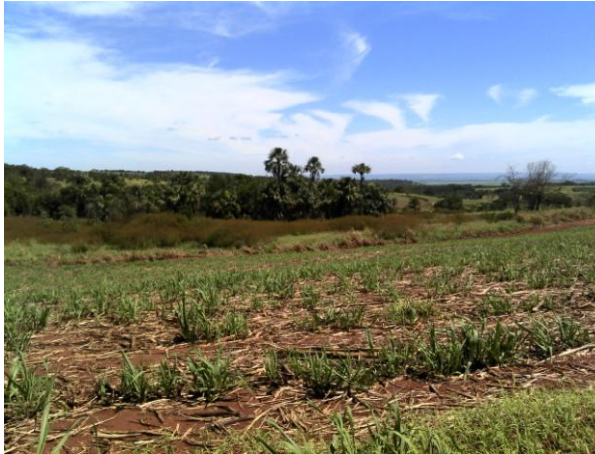
Figura 5. Área de Preservação Permanente ao fundo