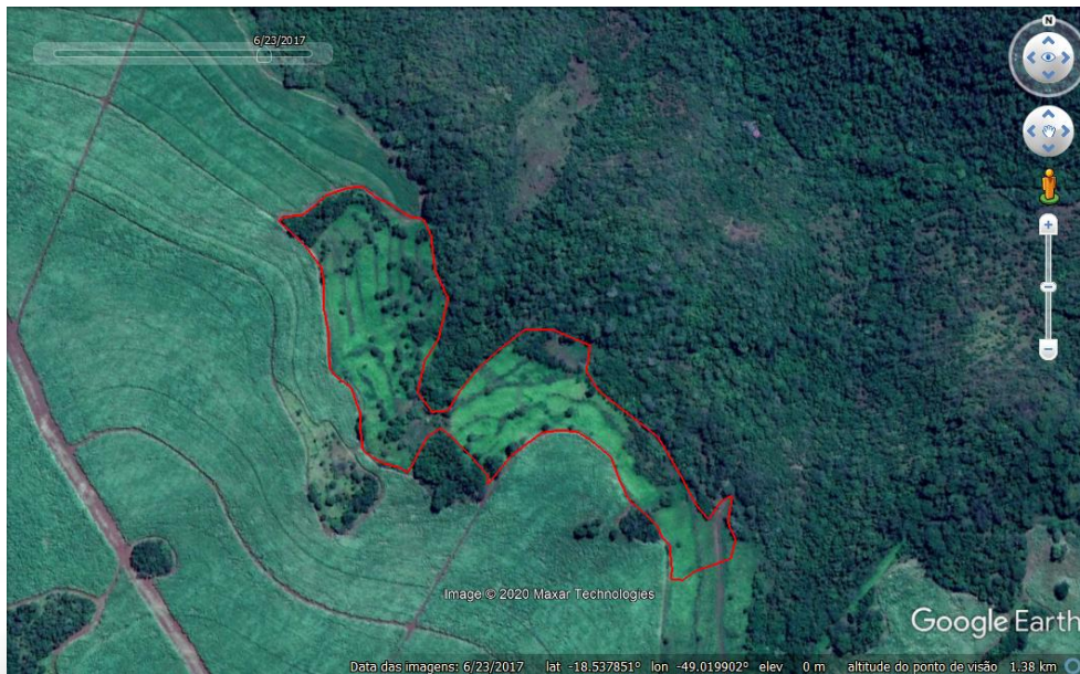
Figura 3. Área a ser recomposta conforme PTRF (2020) apresentado.