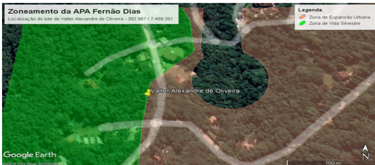
Imagem: Mapa do Zoneamento Ambiental da APA Fernão Dias e a localização do lote nº. 41 da Quadra A, Avenida Serrana, Loteamento Recanto do Selado, Distrito Monte Verde, Camanducaia/MG.

O lote nº. 41 da Quadra A, está localizado dentro da Zona de Expansão Urbana e da Zona de Vida Silvestre (Ver Imagem abaixo) do município de Camanducaia/MG. A intervenção ambiental em 123 m 2 está totalmente inserida na Zona de Expansão Urbana da APA Fernão Dias.