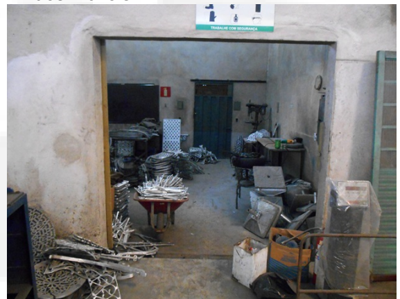
Foto 04. Área de acabamento das peças fundidas que são compradas de terceiros.