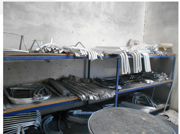
Foto 02. Matérias primas para fabricação dos móveis