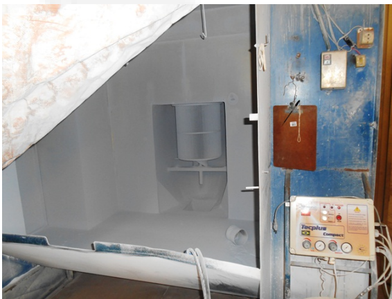
Foto 03. Área de pintura com exaustor e filtro