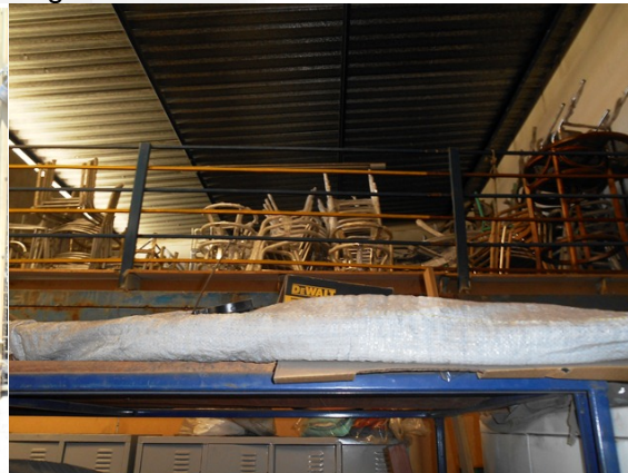
Foto 08. Móveis acabados