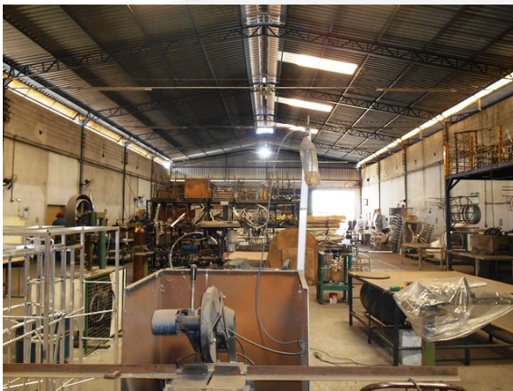
Foto 01. Vista interna do galpão