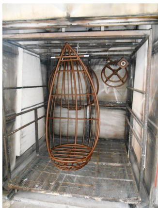
Foto 05. Estufa para fixação da pintura eletrostática