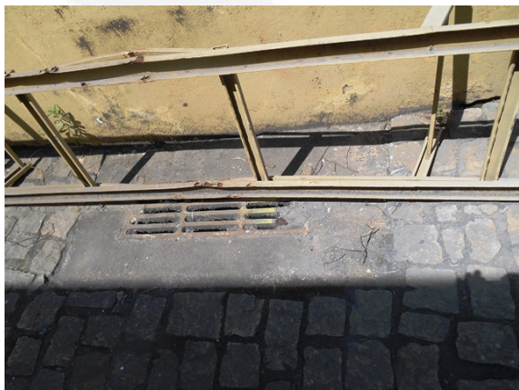
Foto 09. Sistema de drenagem pluvial