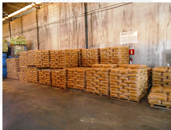
Foto 10. Área utilizada para comércio de produtos refratários e produtos utilizados em fundições.