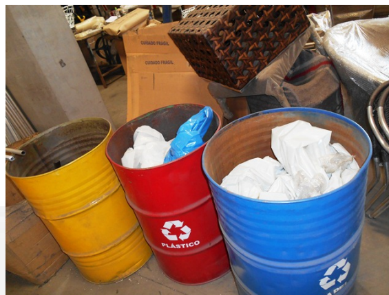
Foto 06. Separação dos resíduos sólidos gerados