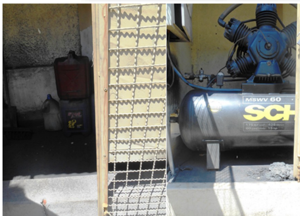
Foto 07. Compressor de ar e resíduos contaminados dispostos de forma adequada.